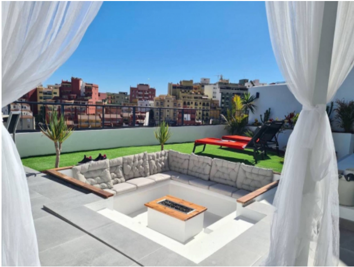
Geräumige Terrasse mit Weitblick