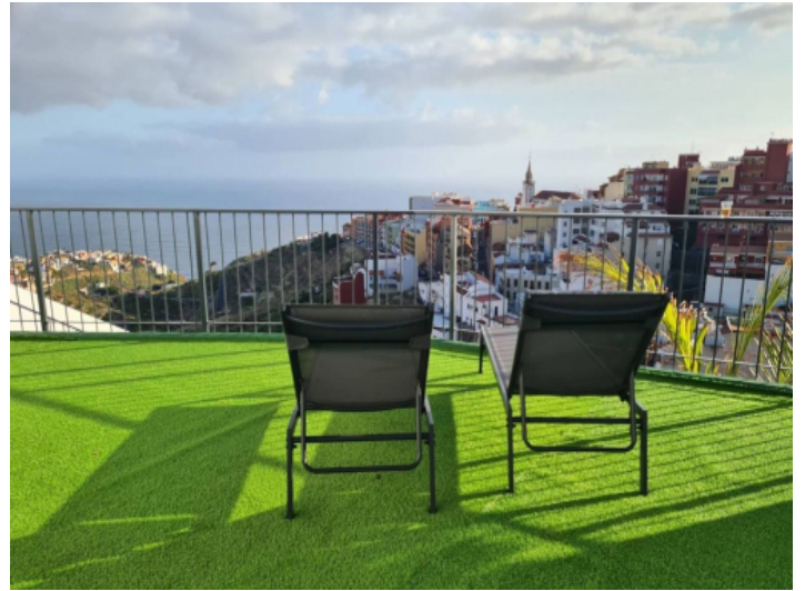
Sonnterrasse mit Meerblick