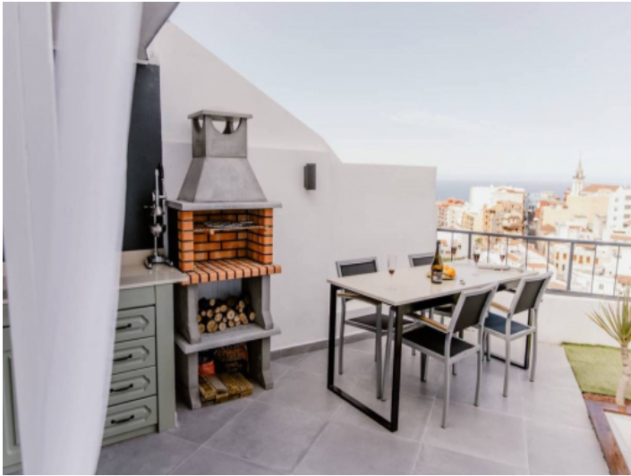
Terrasse mit Ess- und Grillbereich