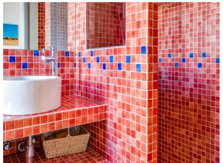
Gästebadezimmer mit Dusche