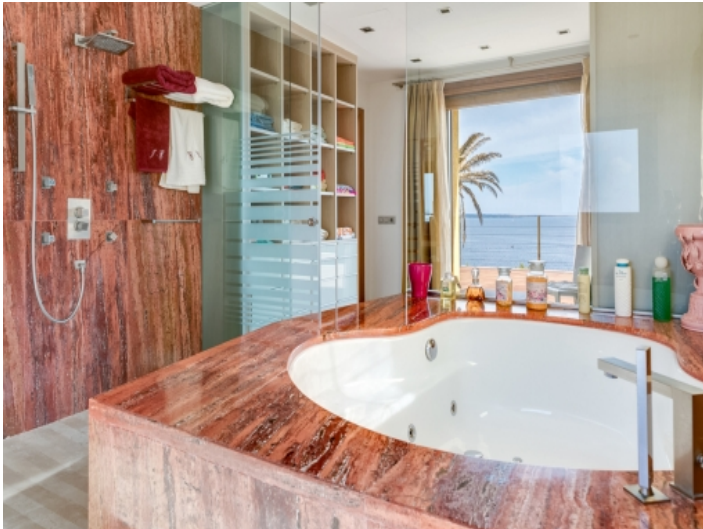
Badezimmer en Suite des Schlafzimmers