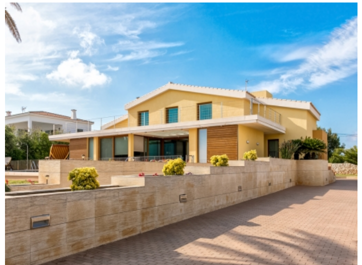
Ansicht der Auffahrt