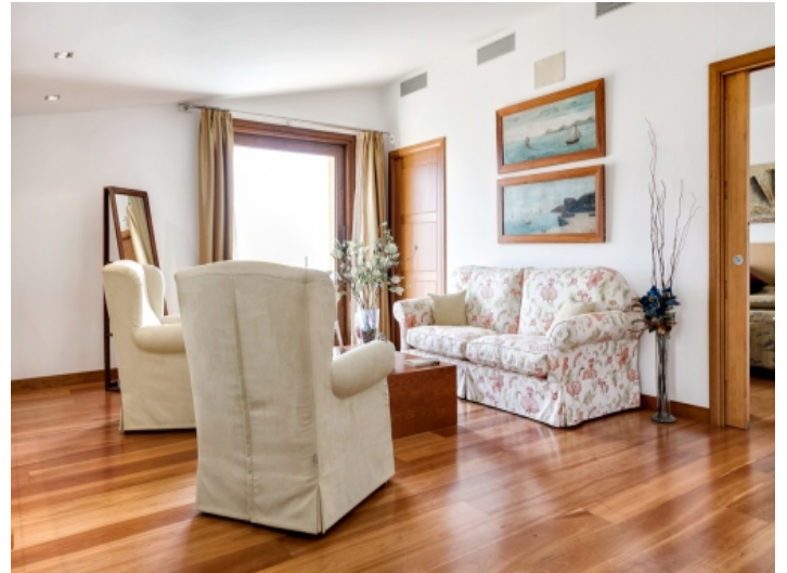
Das Hauptschlafzimmer verfügt über einen eigenen