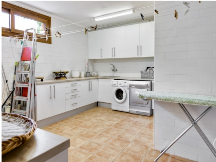
Waschküche der Villa