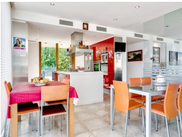
Essbereich in der Küche