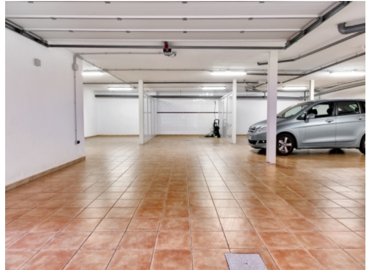
Große Garage des Anwesens