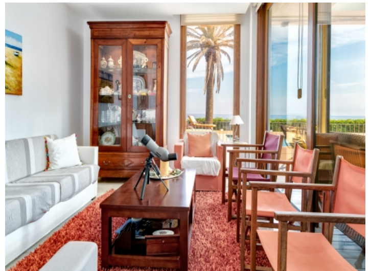
Separater Lounge Bereich