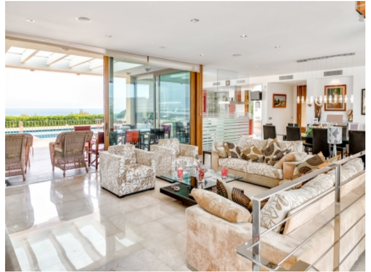
Geräumiger Wohnbereich mit Terrassenzugang