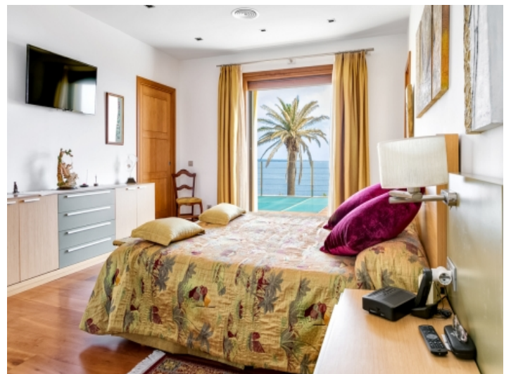
Hauptschlafzimmer mit Meerblick