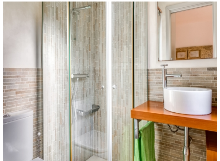
Badezimmer des zweiten Badezimmers