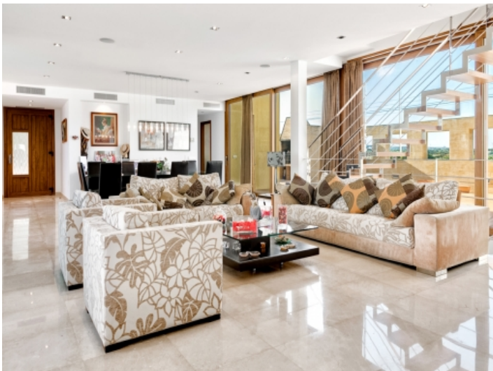
Alternative Ansicht des Wohnbereichs