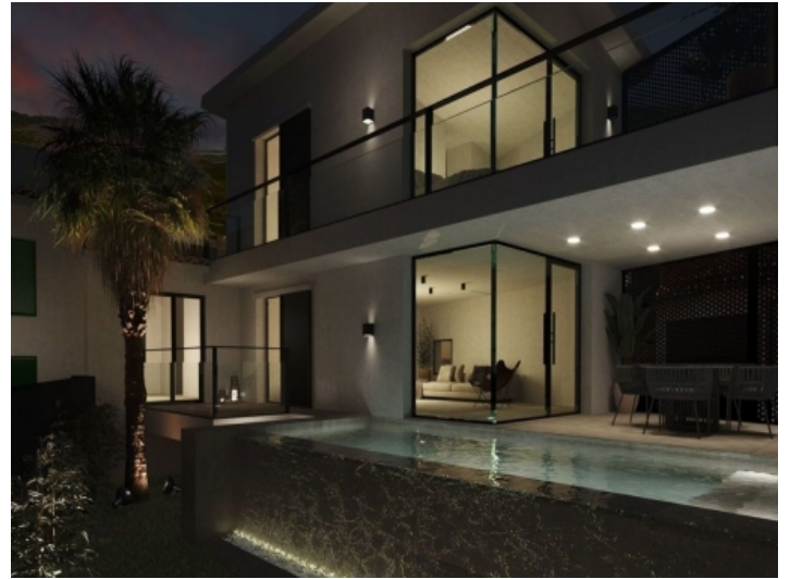
The villa at night