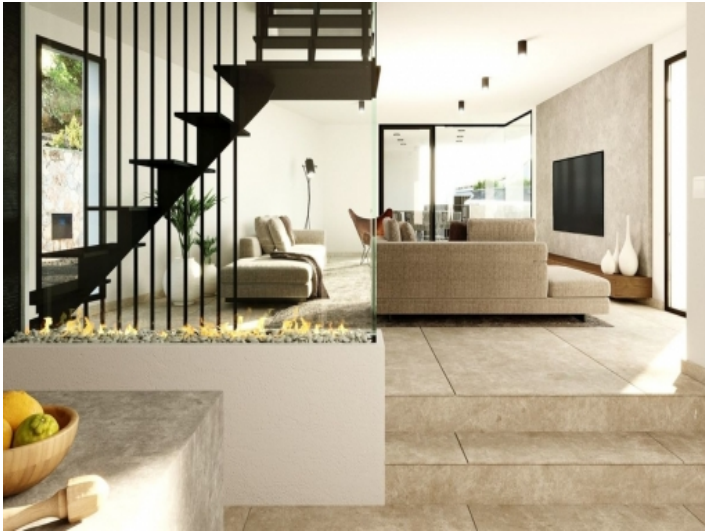
Elegant interior design