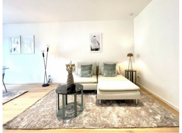
Spacious living area