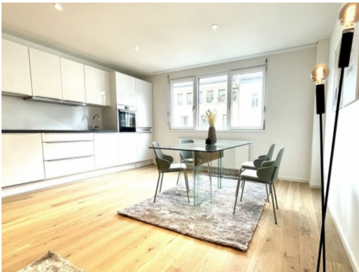
Dining area and kitchen