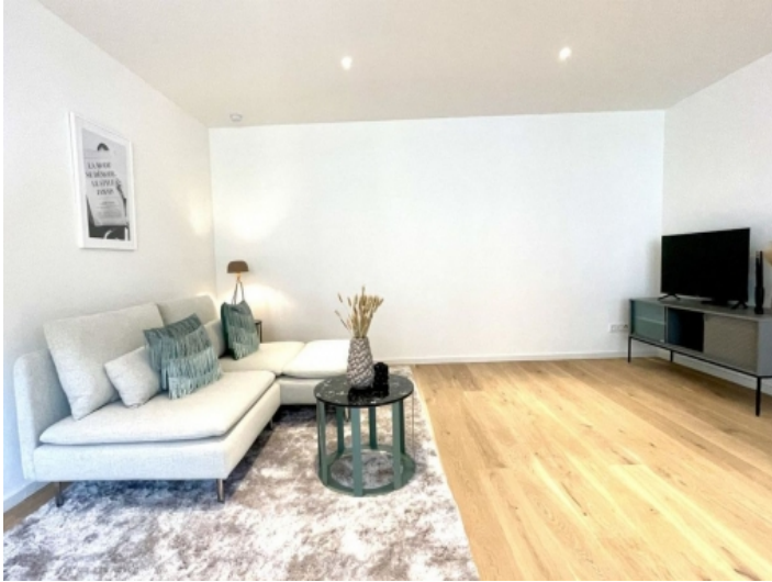
Spacious living area