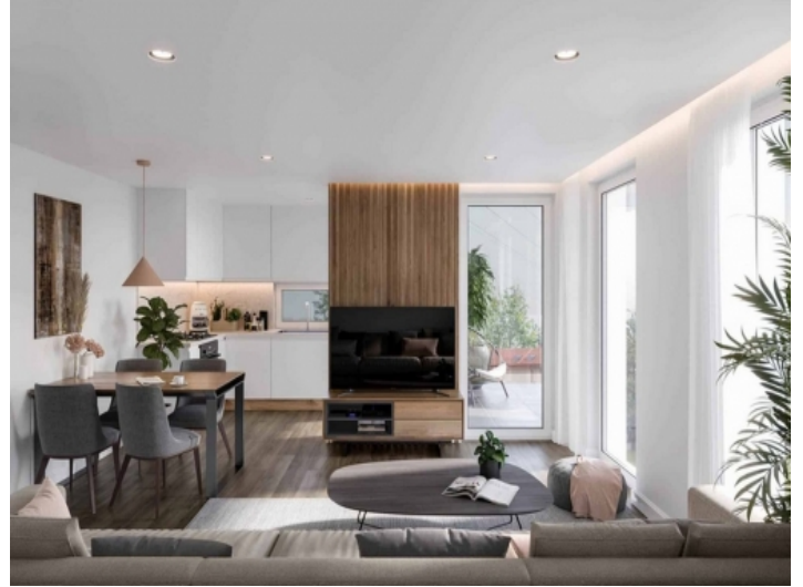
Bright living area