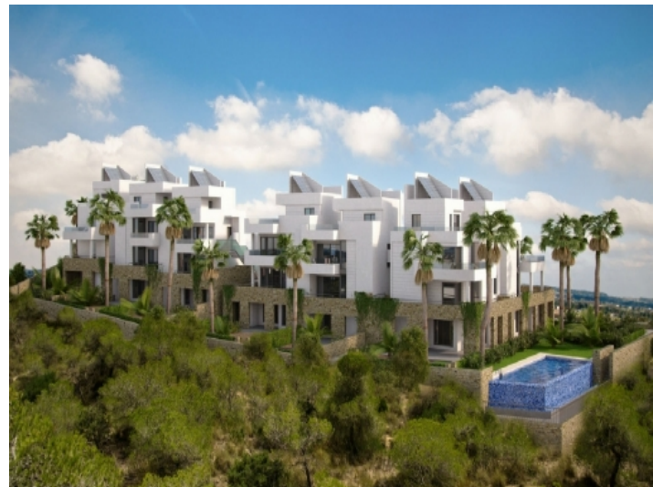
Wohnanlage umgeben von Palmen