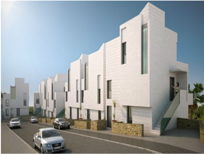
Vorderansicht der Apartments