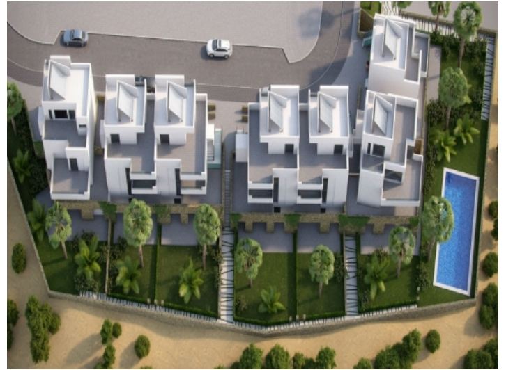
Die Wohnanlage von oben