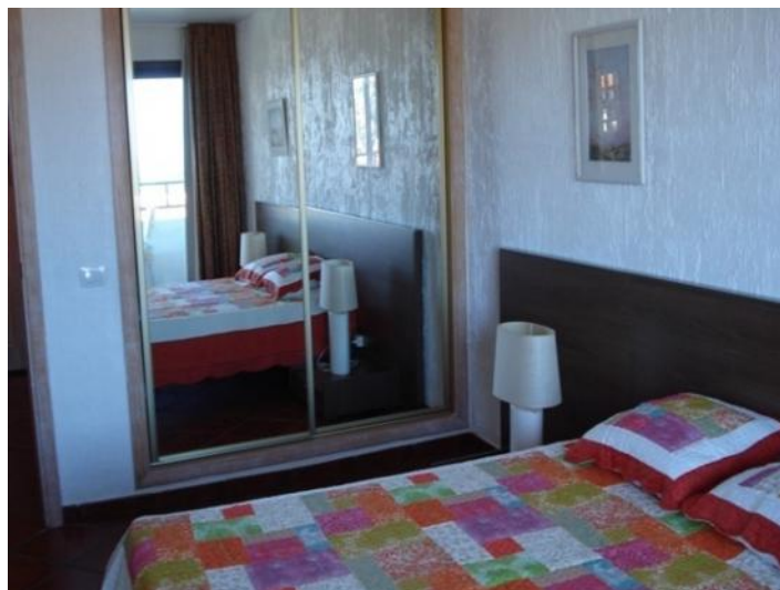
Bedroom with a mirror cabinet