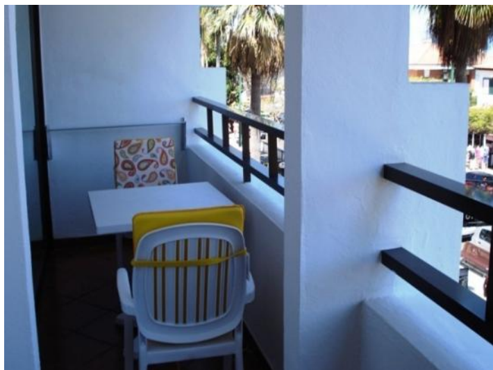
The terrace with double access