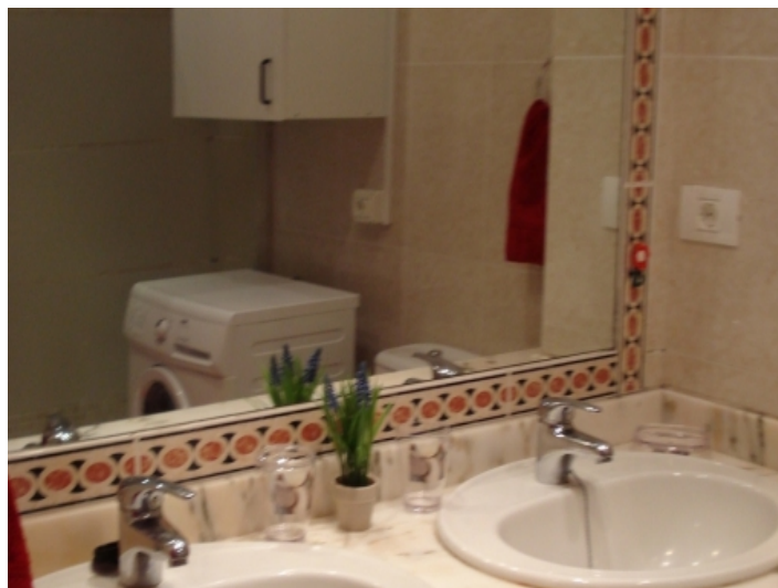
The bathroom with a washing machine