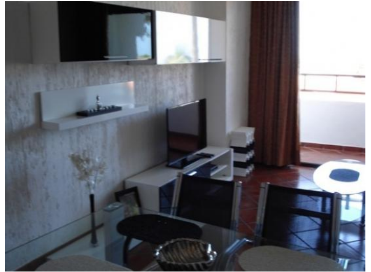
Spacious living room with TV.