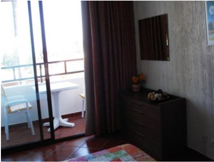
View of terrace from the bedroom