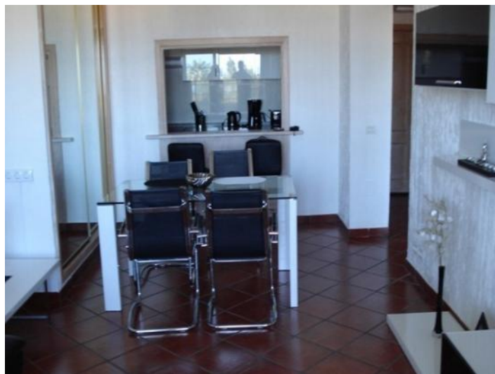
Dining-room with a view to kitchen