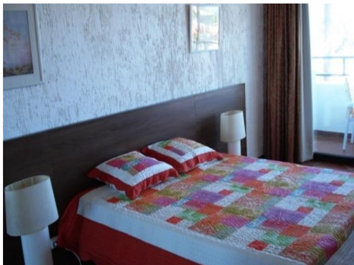
Bedroom with access to terrace