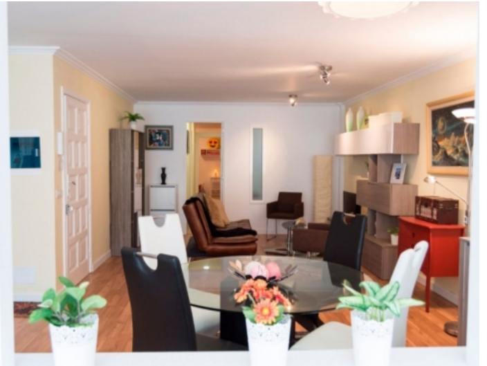
Tolle Wohnung in Strandnähe in Puerto de la Cruz