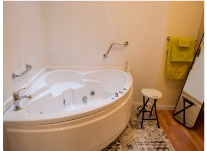
Das zweite Badezimmer mit Jacuzzi