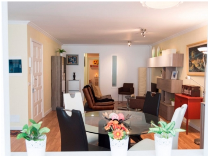
Tolle Wohnung in Strandnähe in Puerto de la Cruz