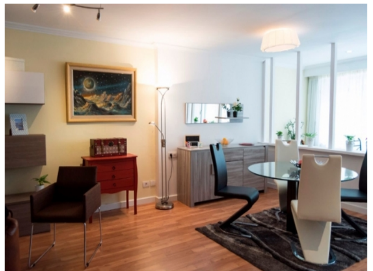
Großzügiger Wohn-und Essbereich