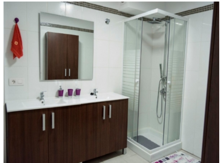
Badezimmer mit Dusche und Doppelwaschbecken