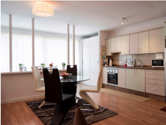
Wohnung, Puerto de la Cruz