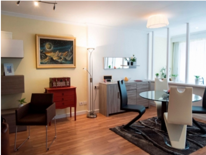
Großzügiger Wohn-und Essbereich