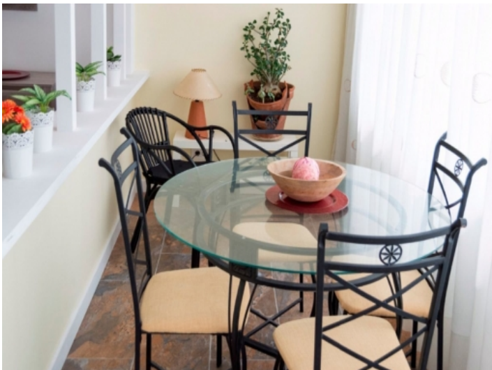
Weiterer separater Essbereich