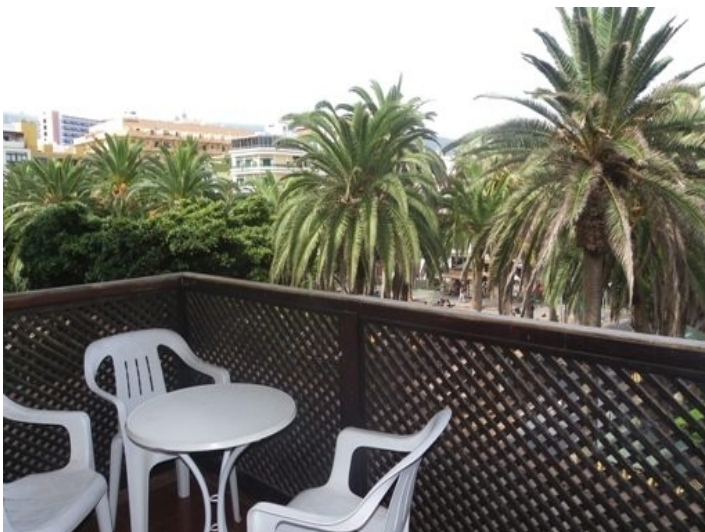
Balcony overlooking Plaza del Charco and Teide