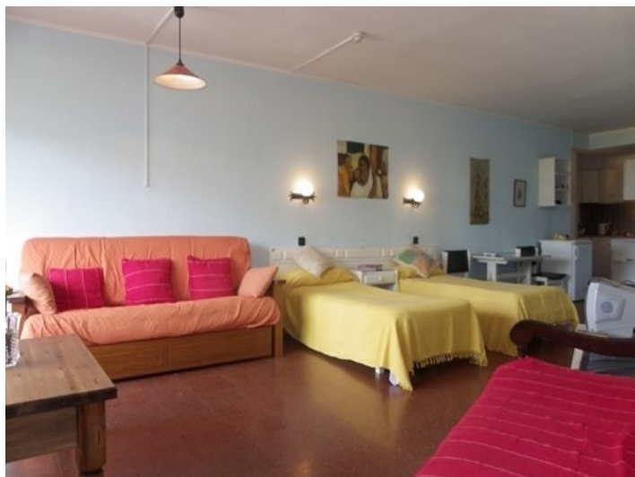
The room in the long shot with the kitchen in the background