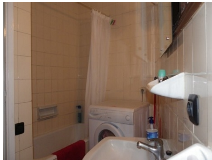
Bathroom with bathtub