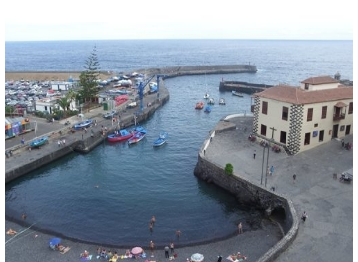
Beautiful view from the rooftop terrace overlooking the