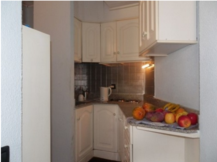
Fully equipped kitchen