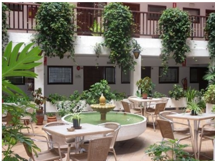
Cosy atmosphere in the patio