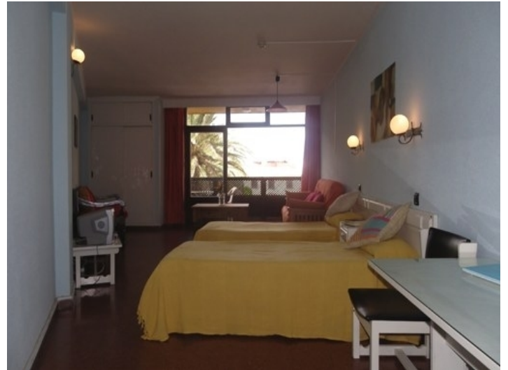
Spacious living and bedroom with balcony