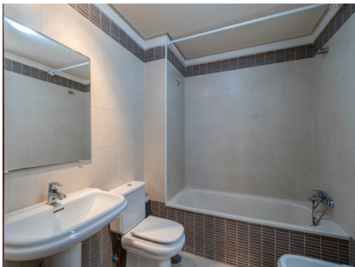
Eines von 2 Bädern