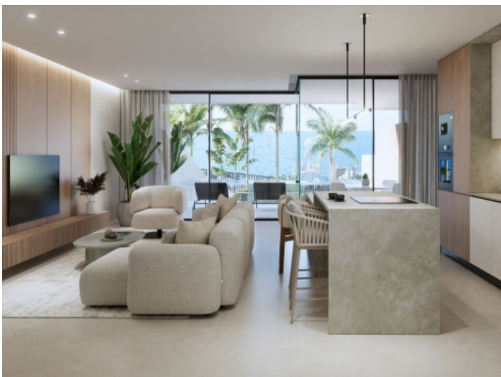
Wohnbereich und Küche