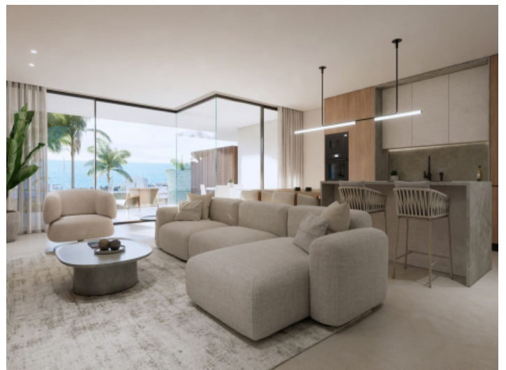
Wohnbereich und Küche