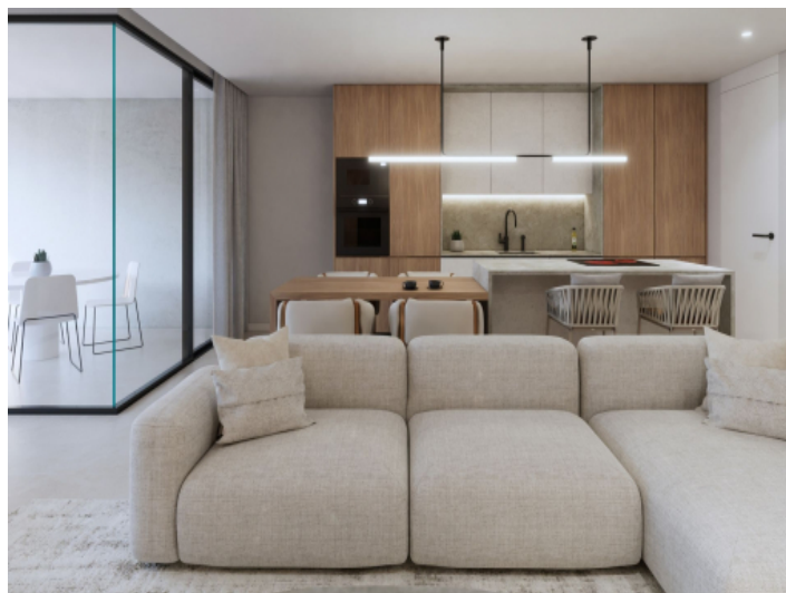
Wohnbereich und Küche