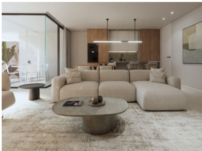
Wohnbereich und Küche