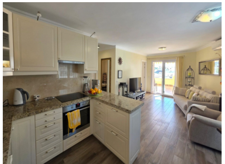
Küche und Wohnbereich