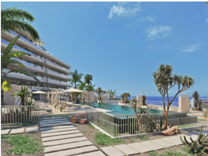
Pool und Garten