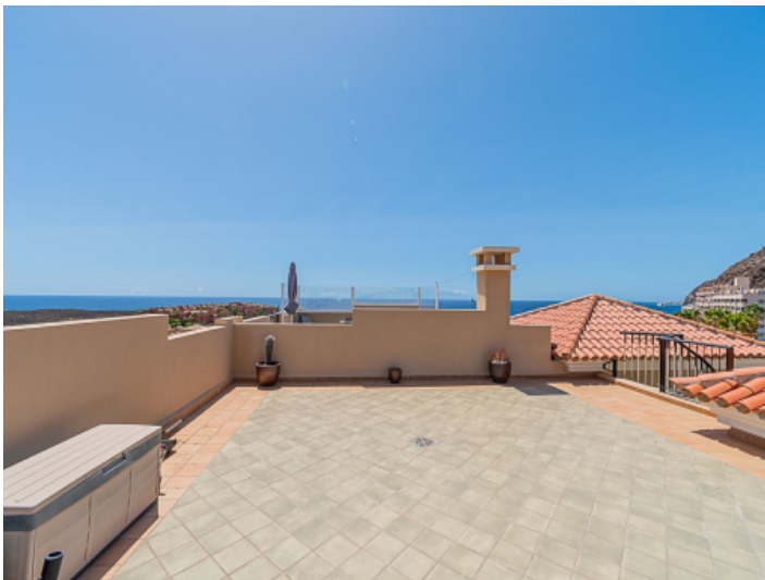
Dachterrasse mit Weitblick