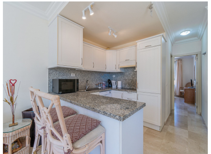
Praktische Küche mit Essinsel