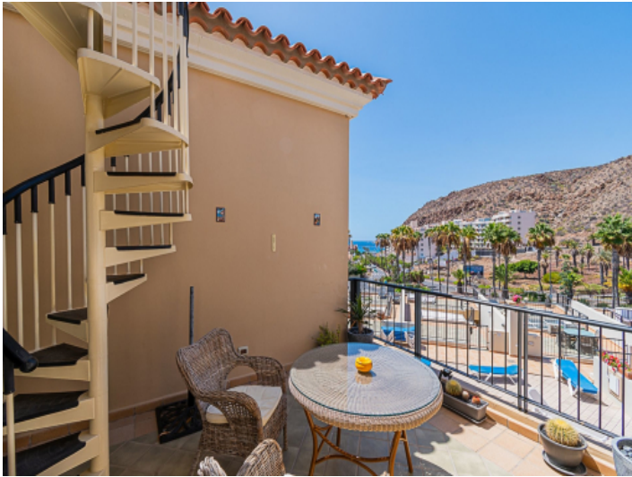
Terrasse mit Aussicht