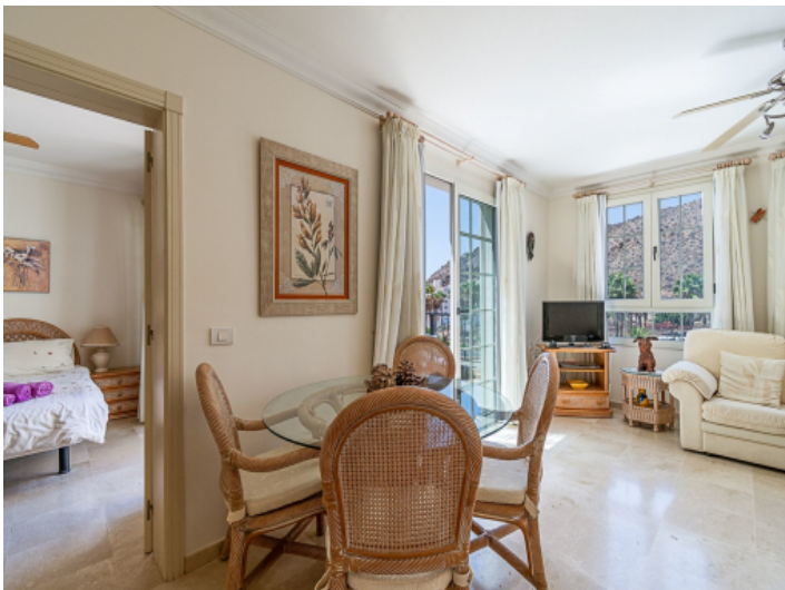
Helles Penthouse in bester Lage