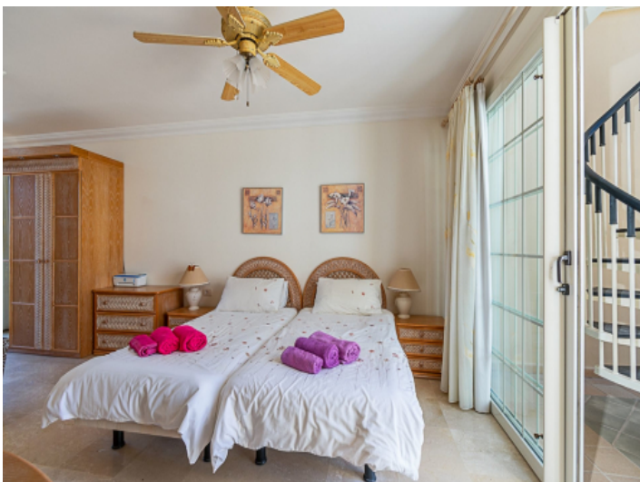
Schlafzimmer mit Bad en Suite