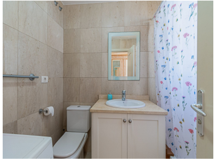
Ein weiteres Badezimmer