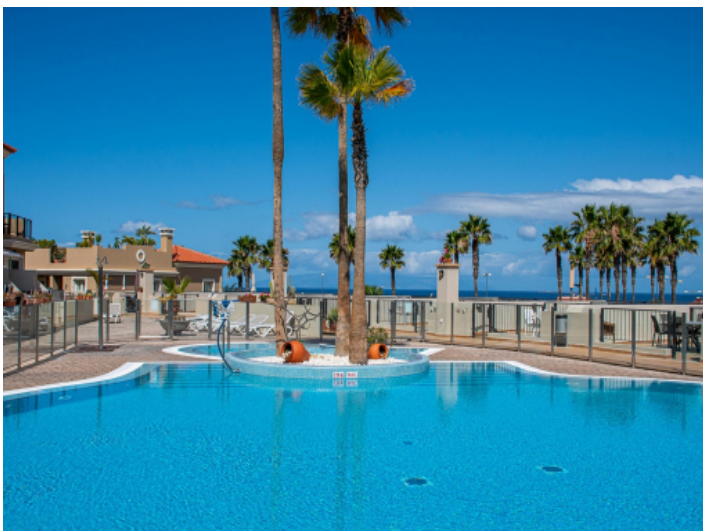
Sehr schöner und gepflegter Gemeinschaftspool