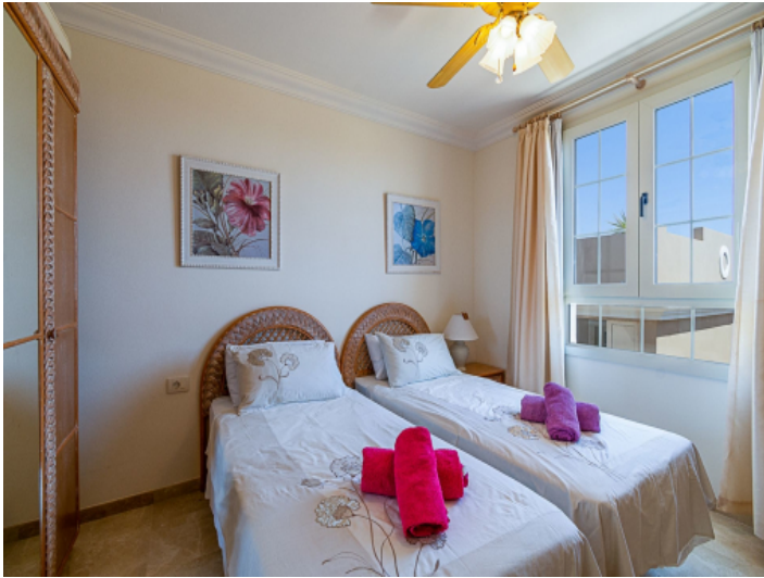
Das 2. Schlafzimmer