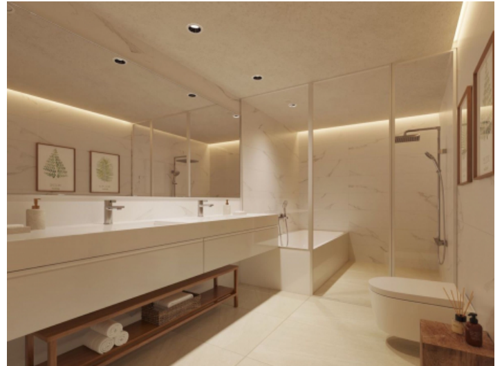
Eines von 5 Badezimmern