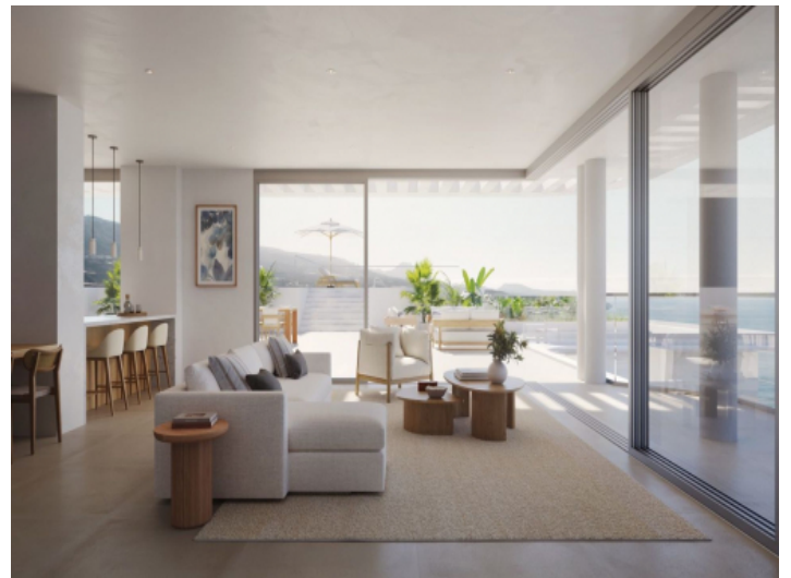
Wohn-/Essbereich mit Meerblick