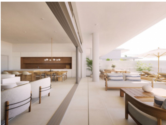
Wohnbereich mit angrenzender Terrasse