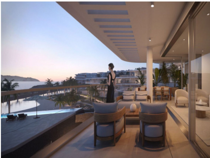
Überdachte Terrasse mit Meerblick