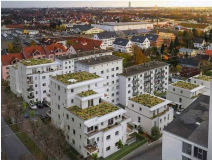
Außenansicht des Bauprojekts