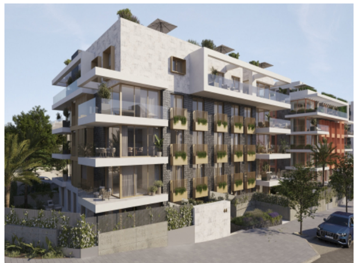
Ansicht des Gebäudes