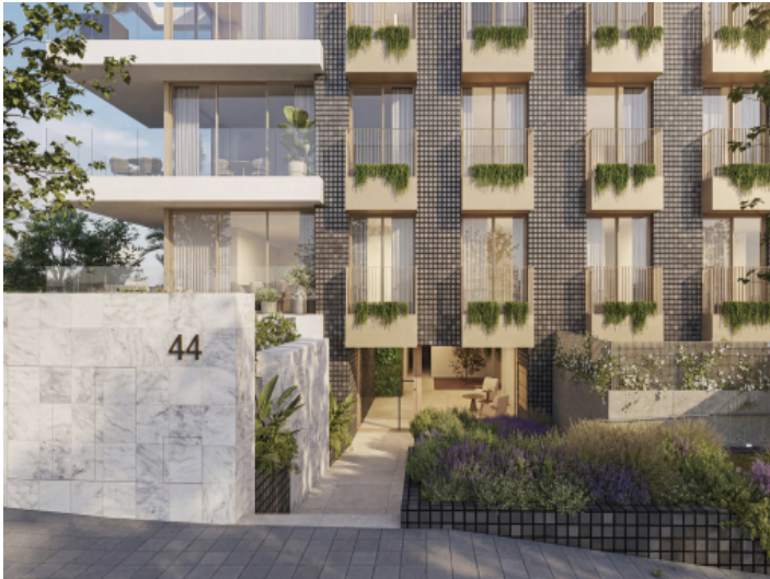
Eingang zum Gebäude