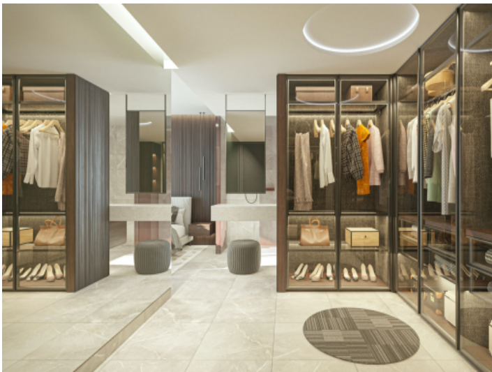
Master-Schlafzimmer mit Ankleide