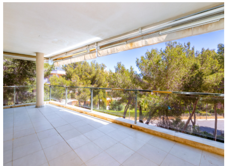
Überdachte Terrasse der Wohnebene