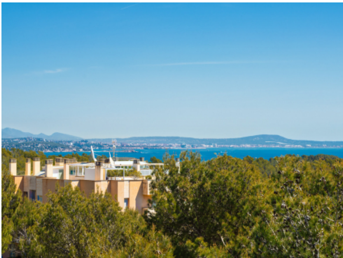
Teil-Meerblick von der Dachterrasse