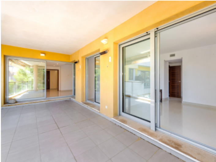
Überdachte Terrasse der Wohnebene