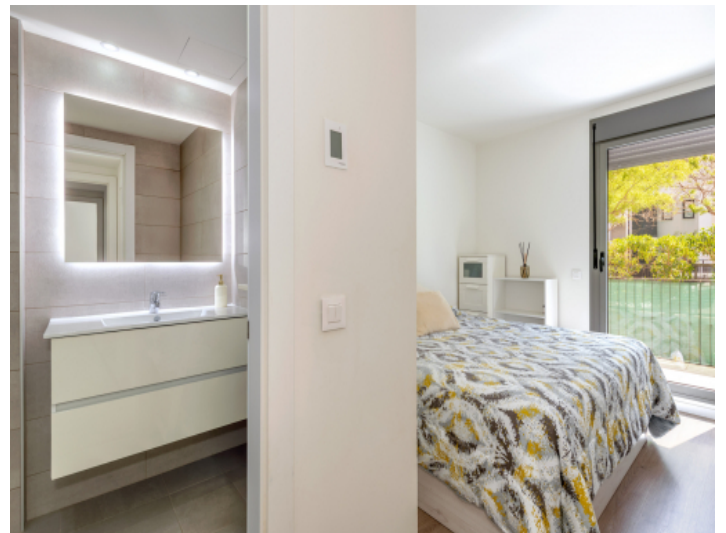
Schlafzimmer in suite