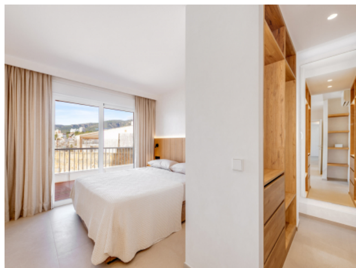
Master-Schlafzimmer mit Ankleidebereich