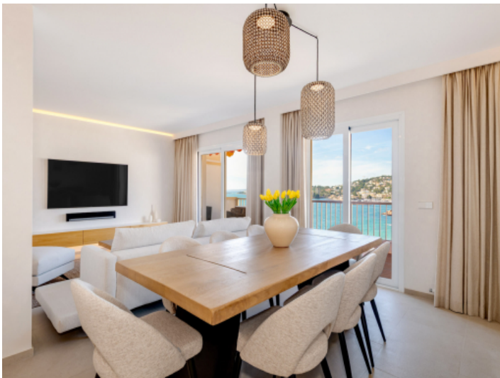
Essbereich mit Meerblick