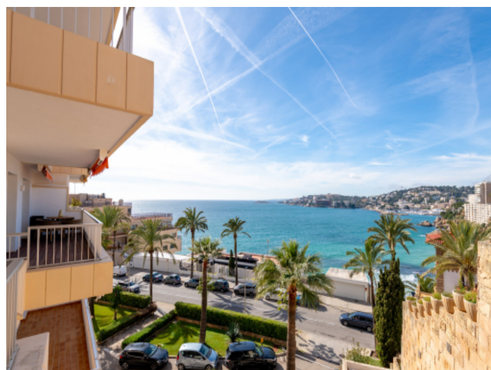
Terrasse des Master-Bereichs