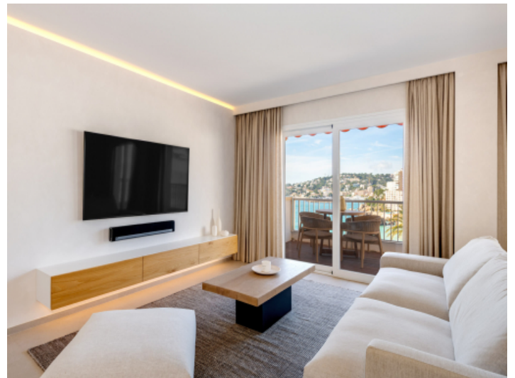
Blick vom Wohnbereich