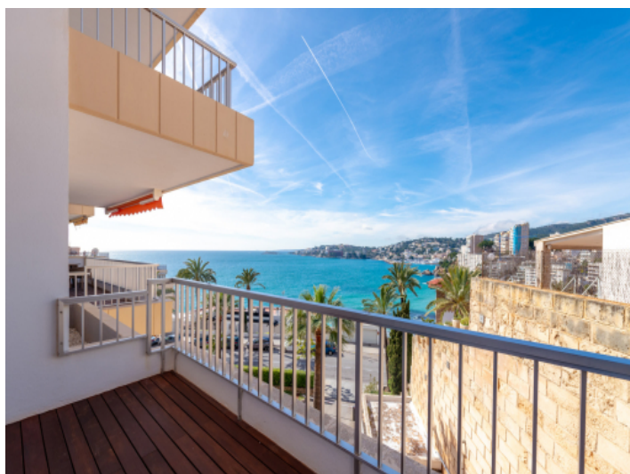
Terrasse des Master-Bereichs