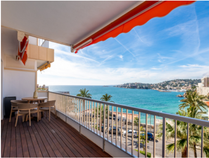
Meerblick von der Terrasse