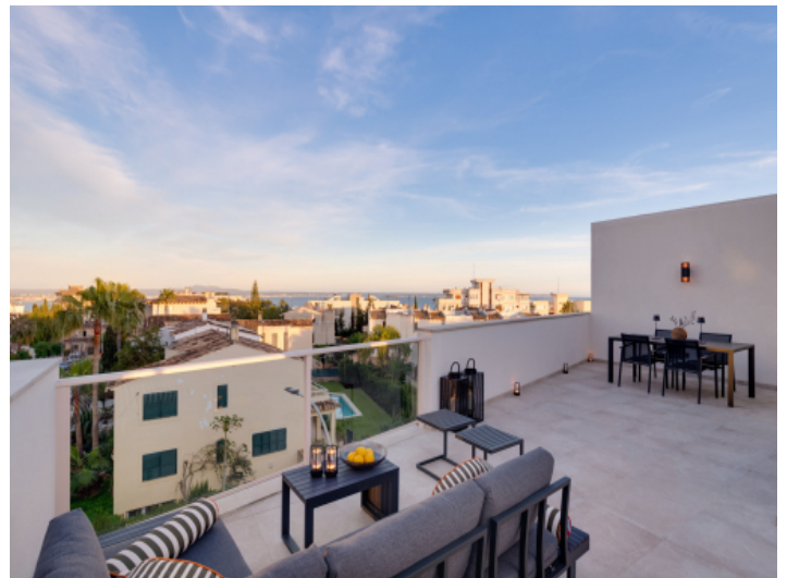
Abendstimmung über Palma