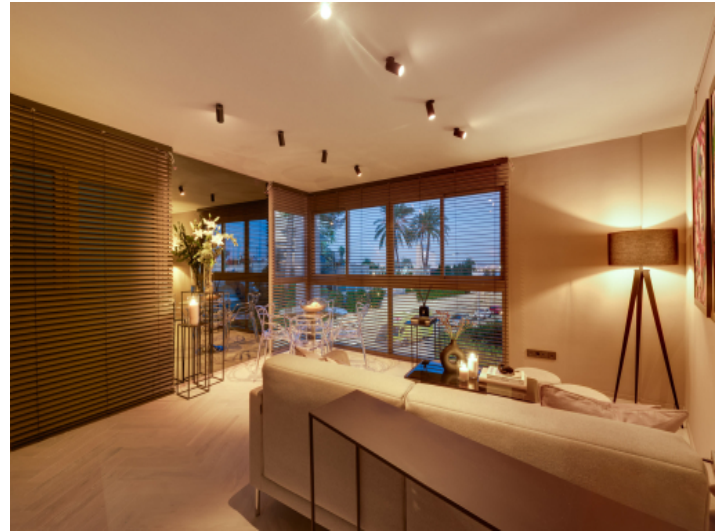
Dim to Warm Lichtkonzept