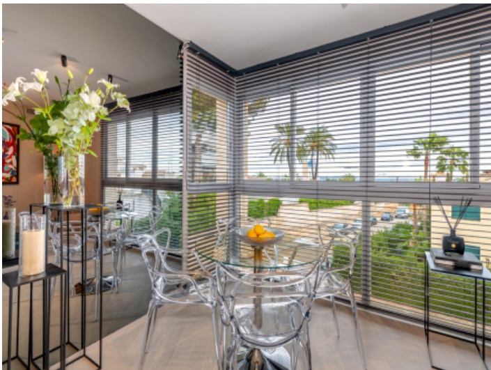
Essbereich mit Blick