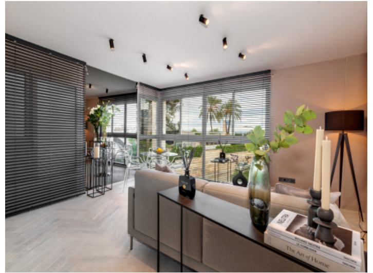
Wohnzimmer mit Meerblick