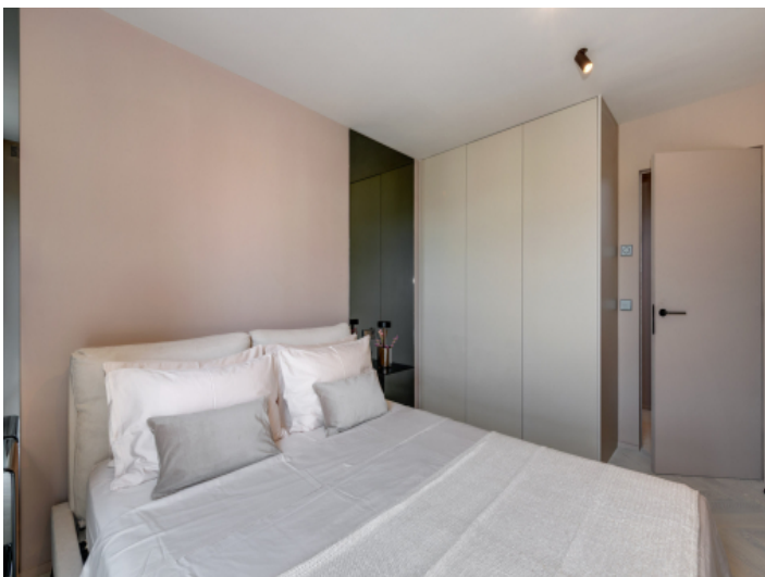
Einbauschränke im Schlafzimmer