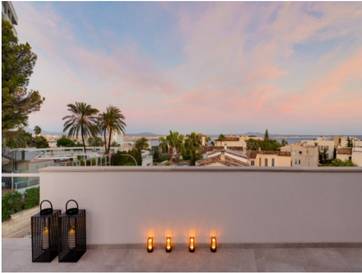
Dachterrasse am Abend