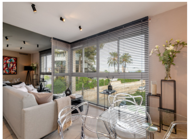
Couch am Fenster