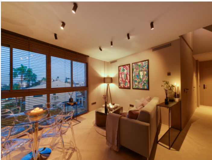
Lichtstimmung am Abend