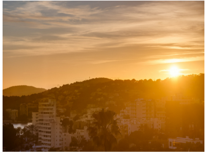
Goldene Stunde Terrasse