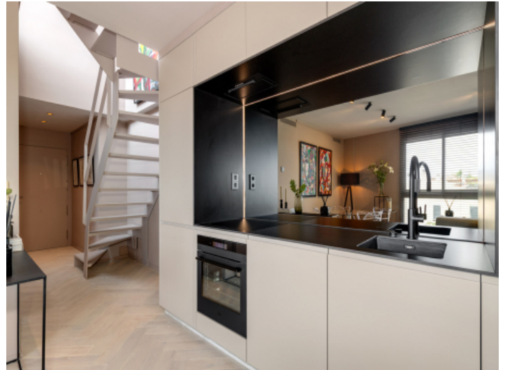
Küche und Flur