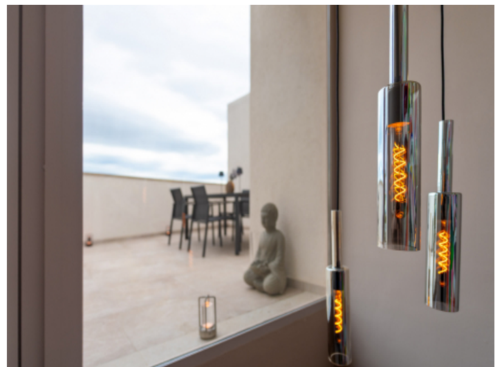
Aufgang zur Dachterrasse