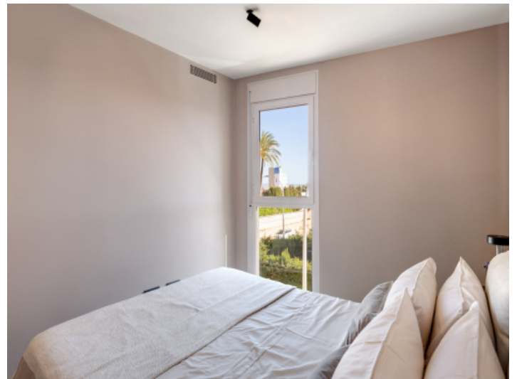
Schlafzimmer mit Ausblick