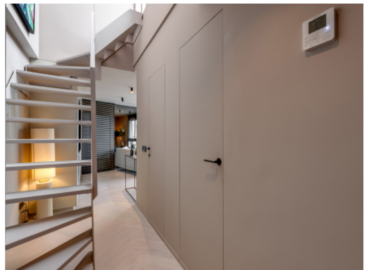
Flur mit Tapentüren