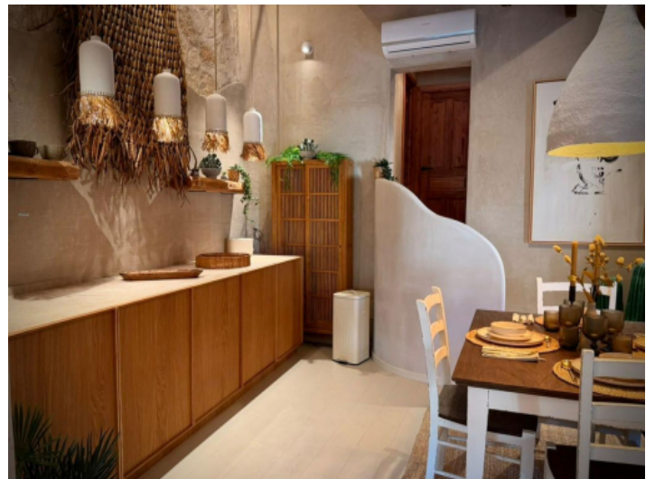
Offener Wohn und Essbereich