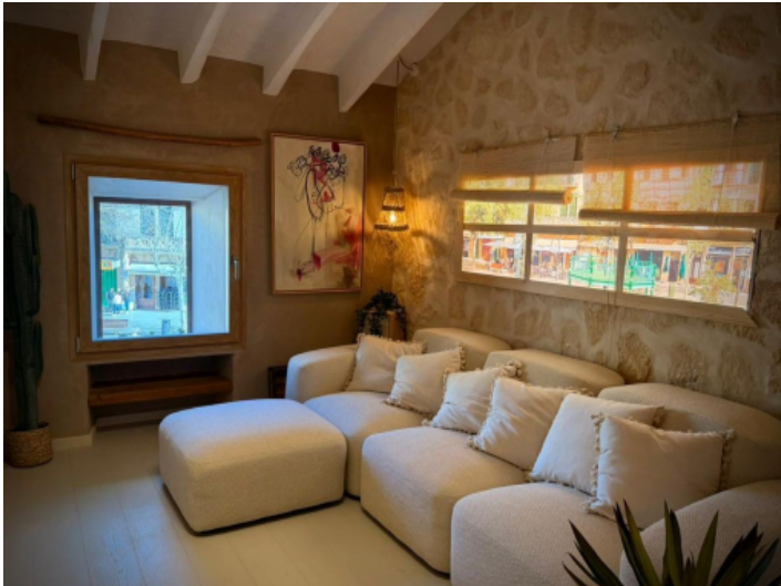
Wohnzimmer mit Blick auf den Plaza