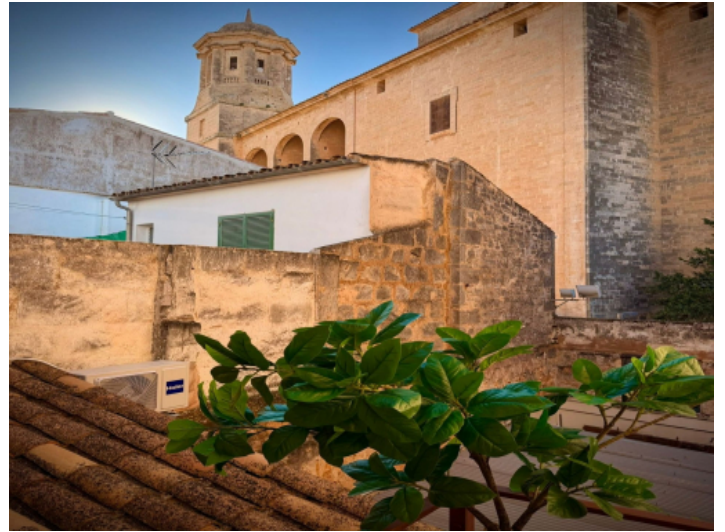
Kirche in Llucmajor