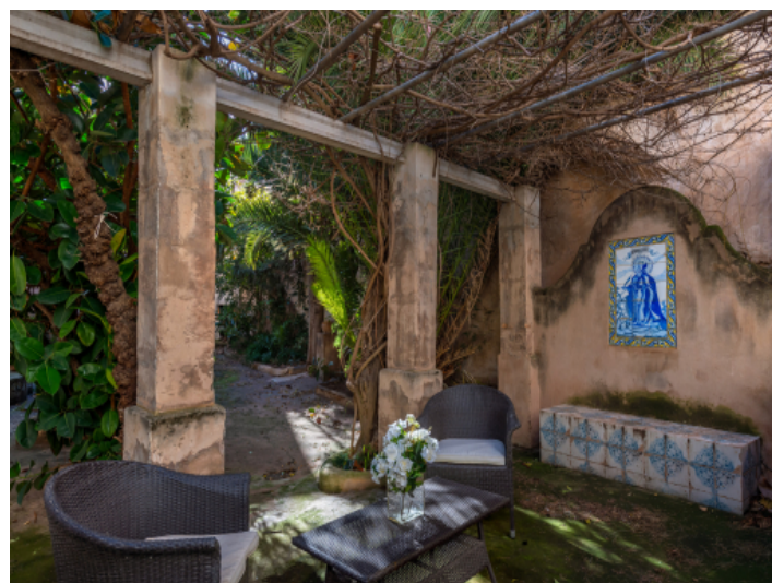
Ecke des Gartens