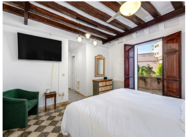
Schlafzimmer mit Badezimmer