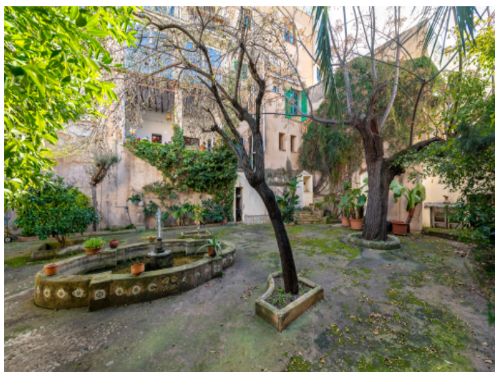
Garten mit patio