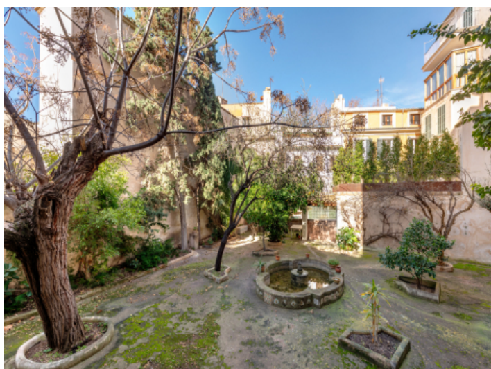
Gartenwohnung in Palma Altstadt