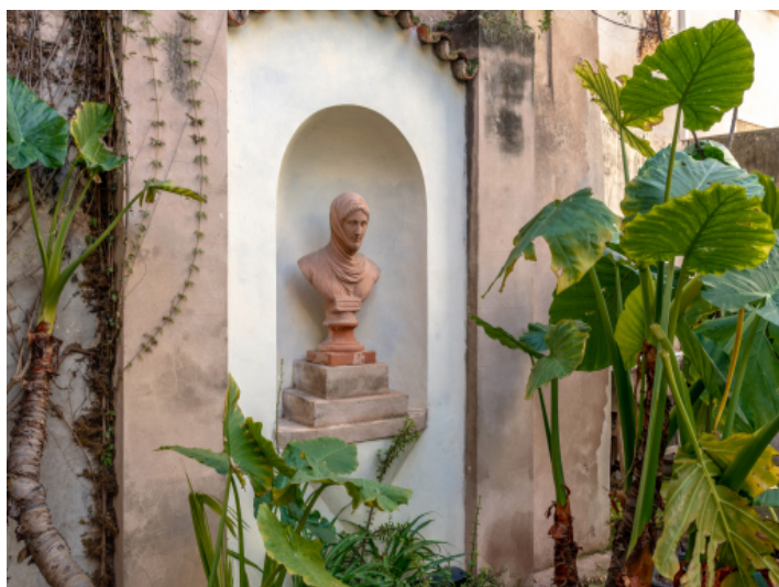
Detail des Gartens