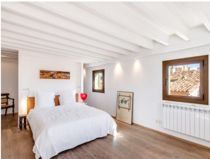
Hauptschlafzimmer mit Ankleidebereich