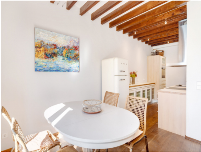
Essbereich mit angrenzender Küche