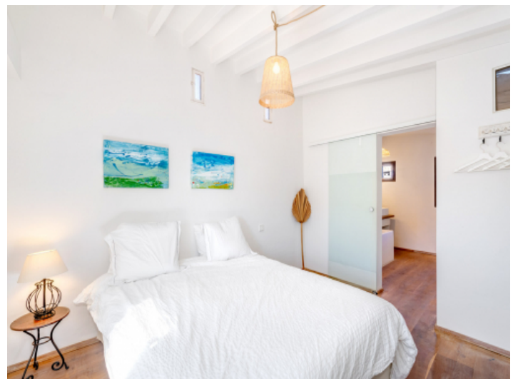
Zweites von drei Schlafzimmern