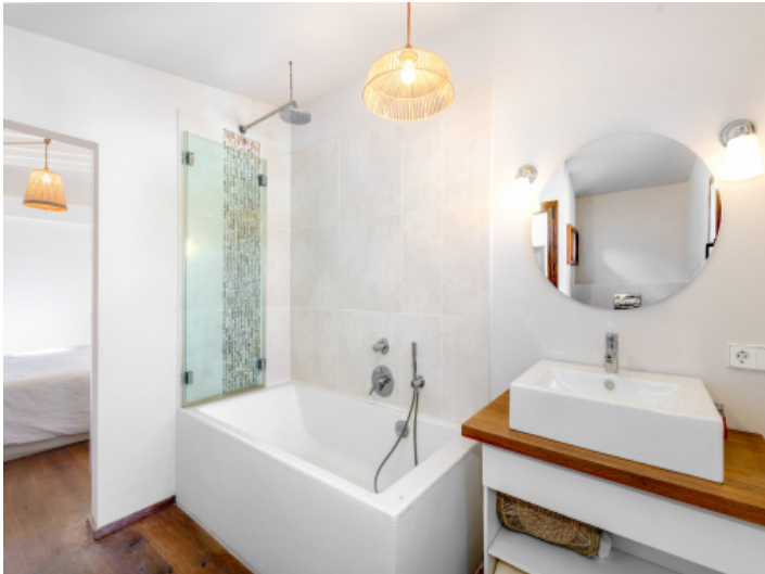
Weiteres Badezimmer en Suite