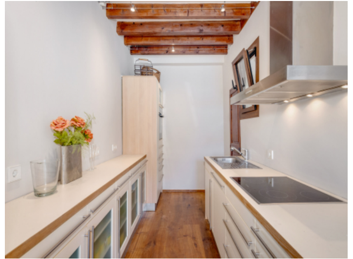
Einbauküche mit anschließender Vorratskammer