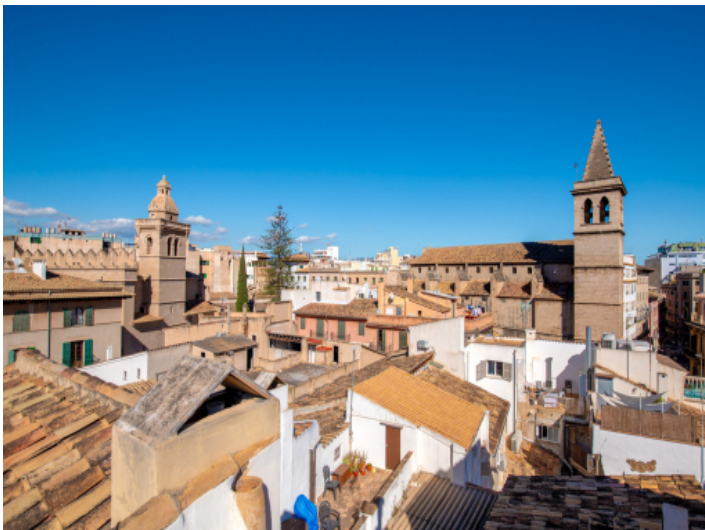
Blick über die Dächer der Altstadt