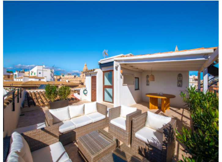
Dachterrasse mit überdachtem Bereich