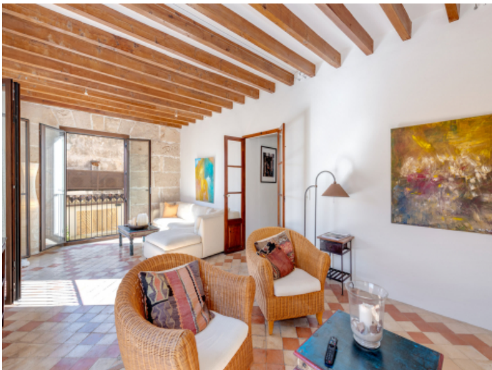
Helles Wohnzimmer mit original Deckenbalken