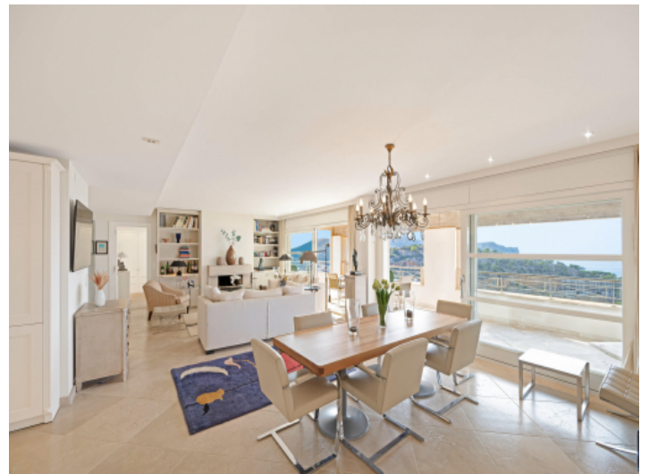
Eleganter Wohn- und Essbereich mit mediterranem Flair und