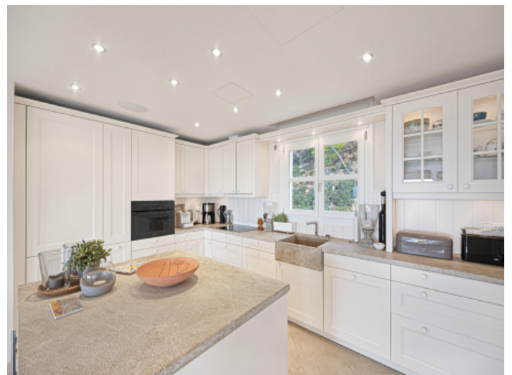
Stilvolle Kochinsel in offener, lichtdurchfluteter Küche