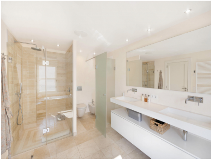
Badezimmer mit Naturstein