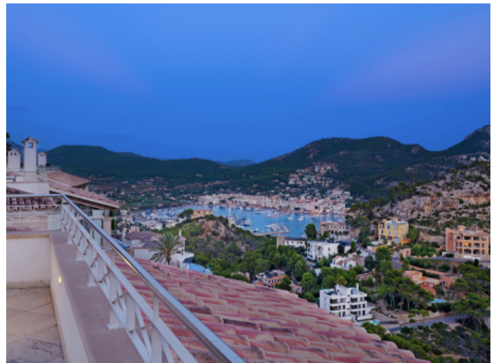
Abendliche Atmosphäre über dem Hafen – direkt von Ihrer Terrasse