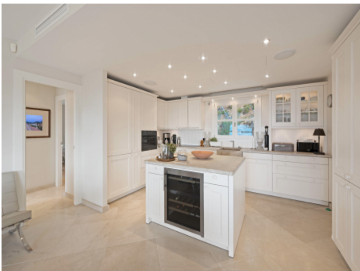
Offene Küche mit Kochinsel und integriertem Weinkühlschrank