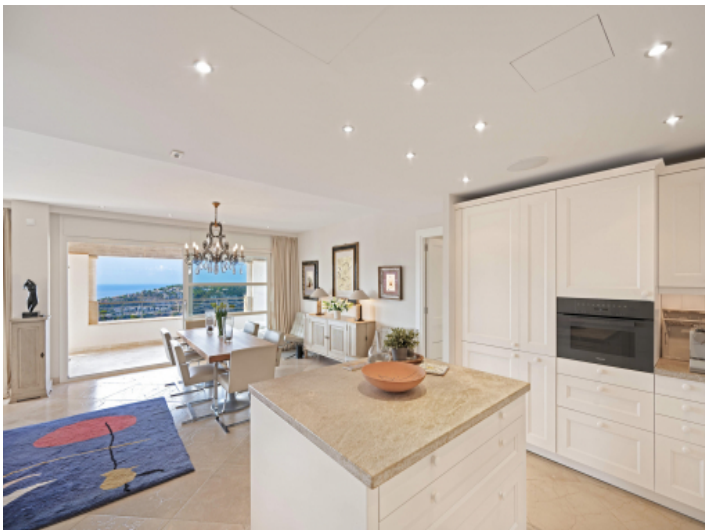
Kochen mit Ausblick: Offene Küche und Panorama aufs Meer