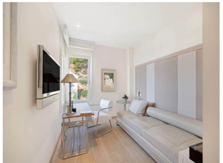
Schlafzimmern mit gemütlicher Atmosphäre