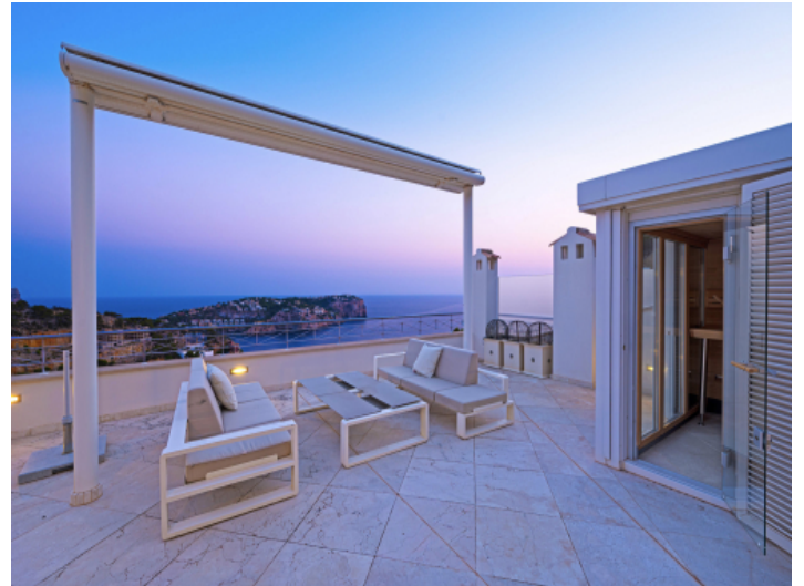
Mediterranes Feeling: Entspannen über den Dächern mit