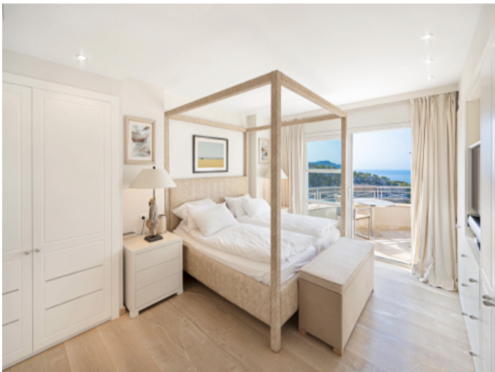
Eines von drei Schlafzimmern mit Meerblick