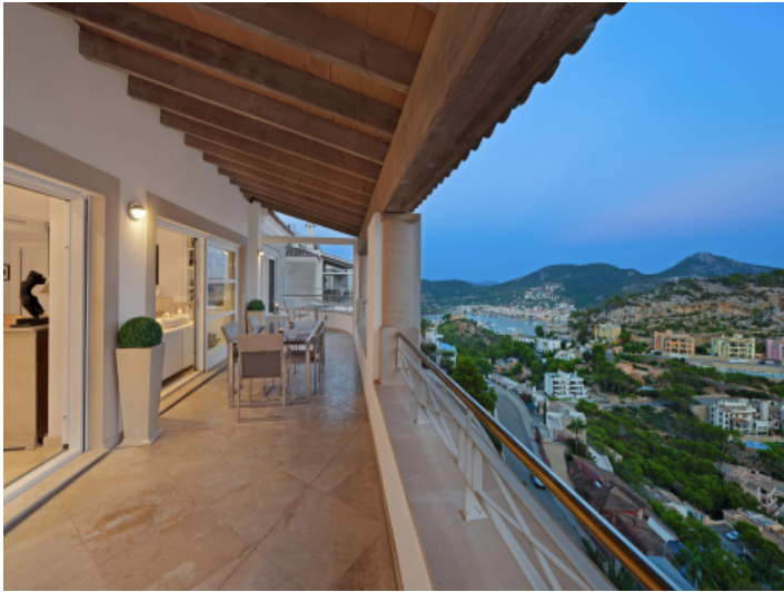
Mediterrane Abendstimmung auf der Terrasse mit Meerblick