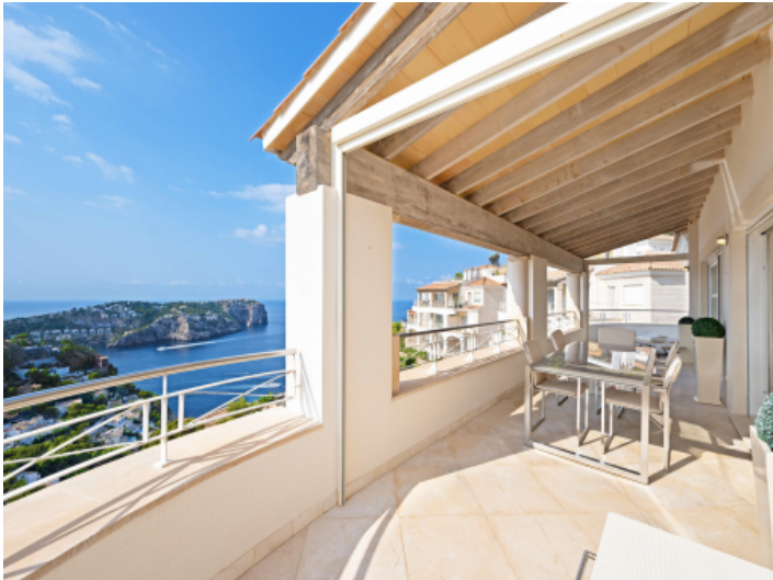
Ruhe und Natur: Panoramablick auf Meer und Berge von der