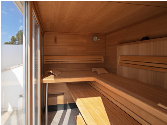
Sauna auf der Dachterrasse