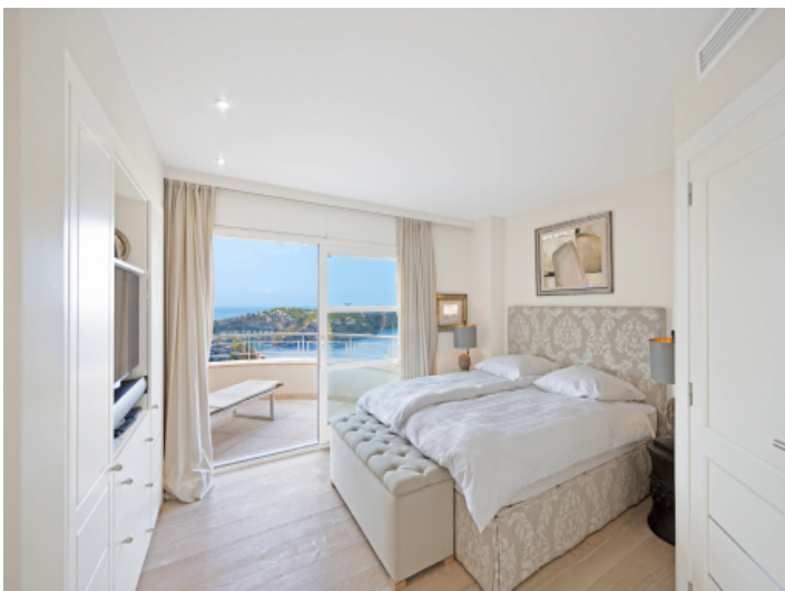
Eines von drei Schlafzimmern mit traumhafter Aussicht