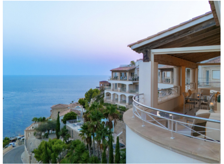
Herrlicher Blick auf das Blau des Meeres und grünes Umland