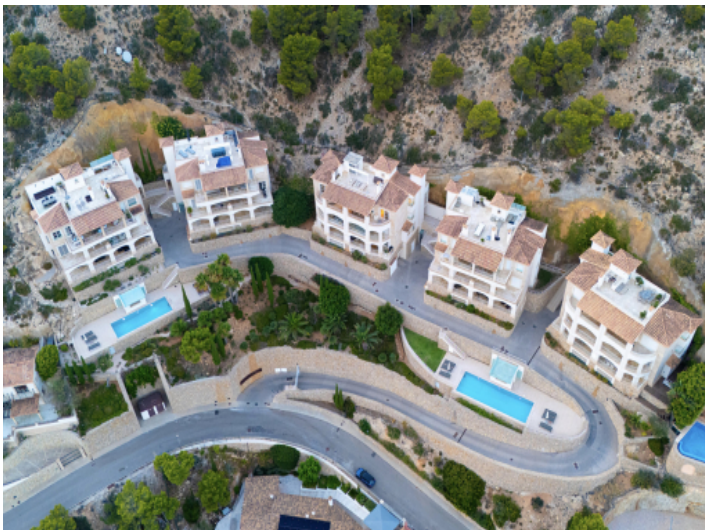
Gemeinschaftsanlage mit großzügigen Pools und