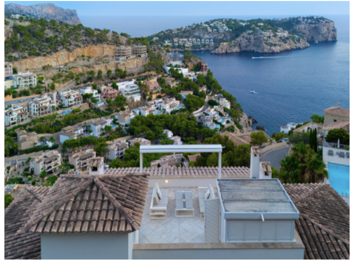
Privater Outdoor-Bereich für entspannte Stunden mit