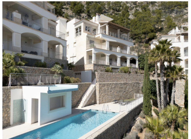
Gemeinschaftsanlage mit großzügigen Pools und