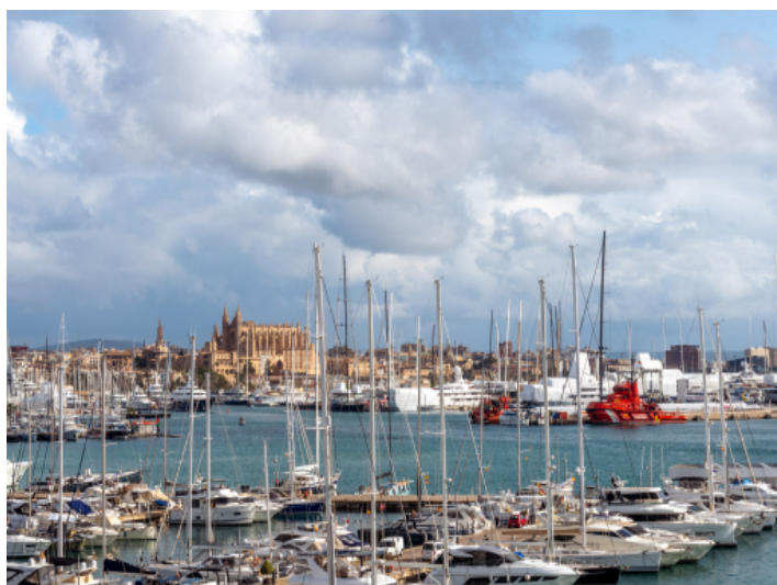
Blick auf den Hafen und die Kathedrale