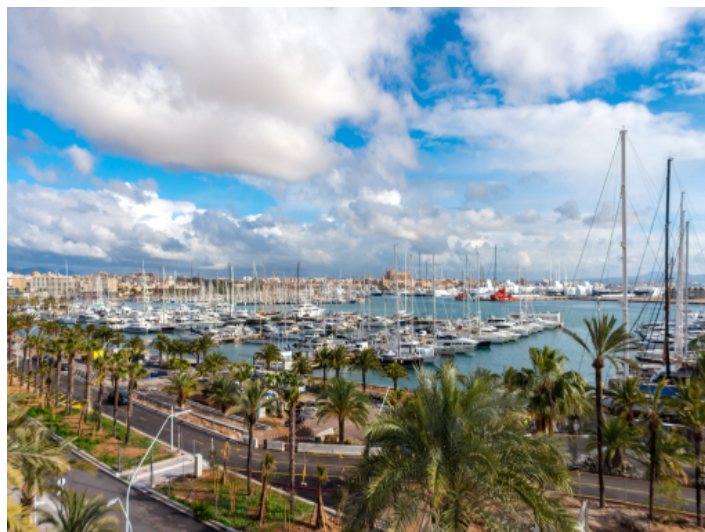
Blick auf den Hafen