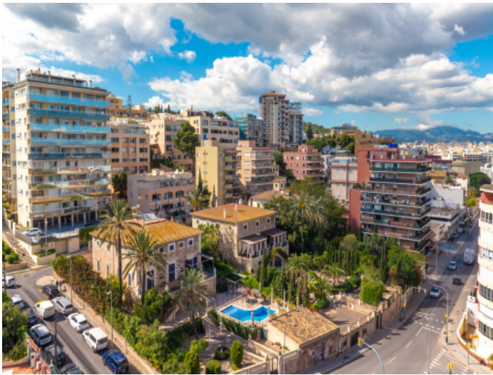
Ausblick auf Bonanova