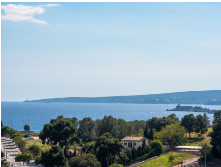
Ausblick auf Portopi