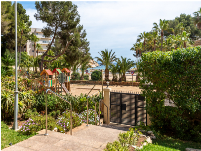
Auf der Strand gehen