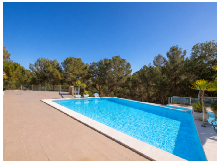
Pool mit Sonnenterrasse