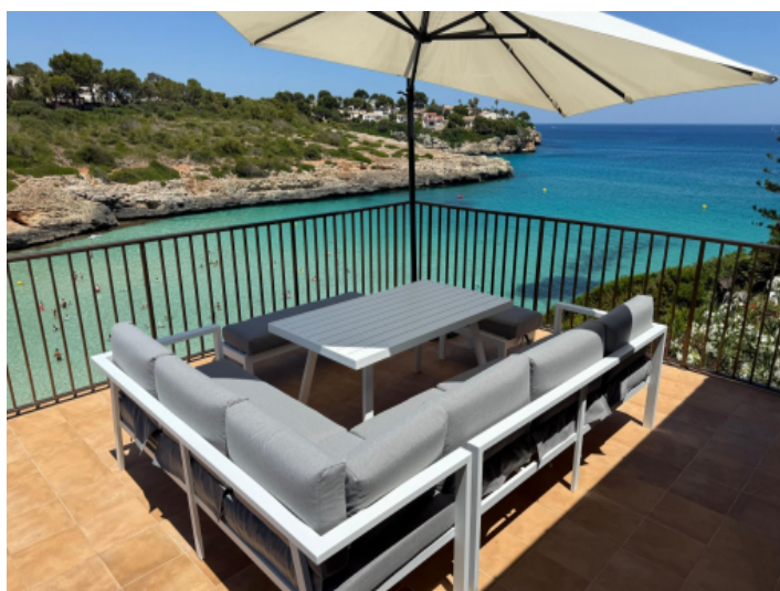
Balkon mit Meerblick