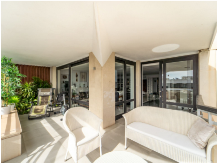
Terasse mit Meerblick