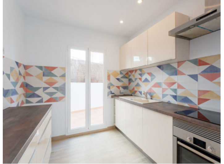
Küche mit Zugang zur Terrasse