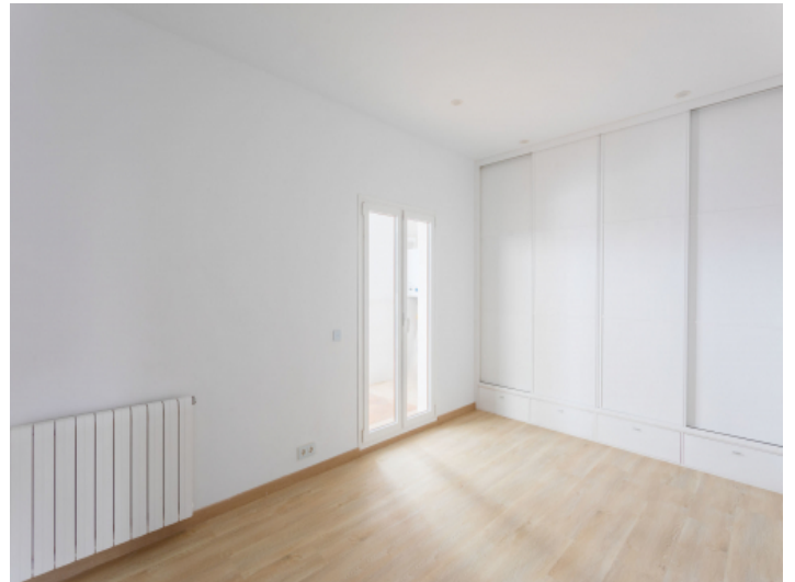
Großes Schlafzimmer mit Bad en suite und Zugang zur