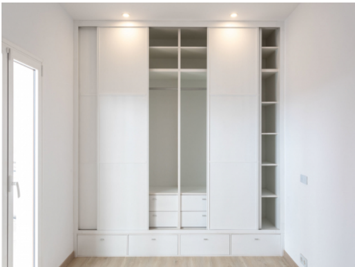
Hochwertiger Einbauschränk im großen Schlafzimmer