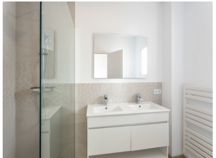
Badezimmer en Suite