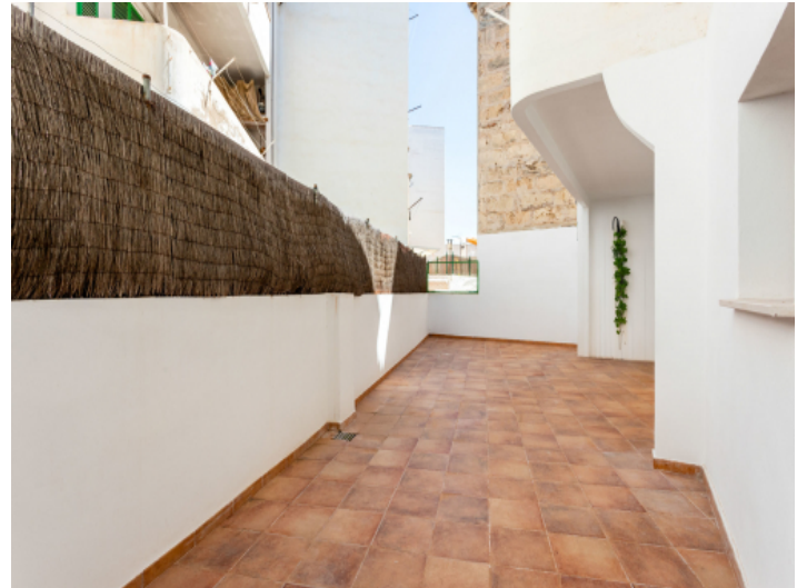
Große, ruhige Terrasse