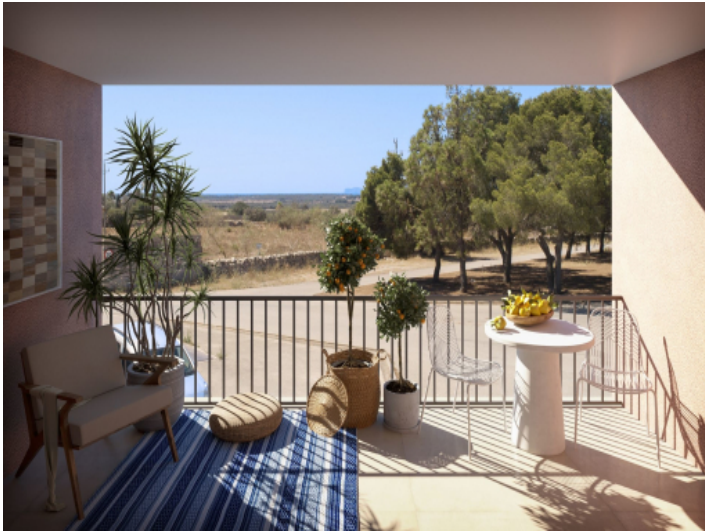
Aussicht auf die Umgebung