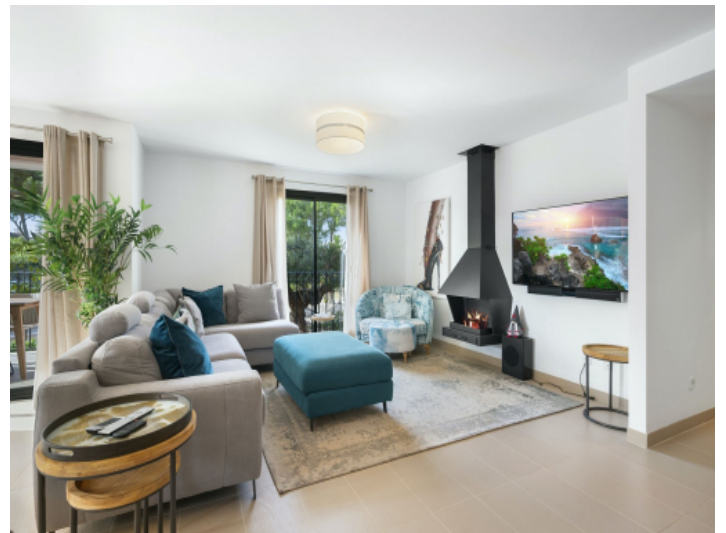
Heller und großer Wohnbereich