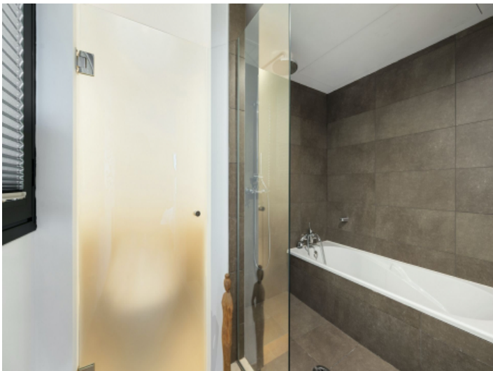
Bad en suite mit separatem WC