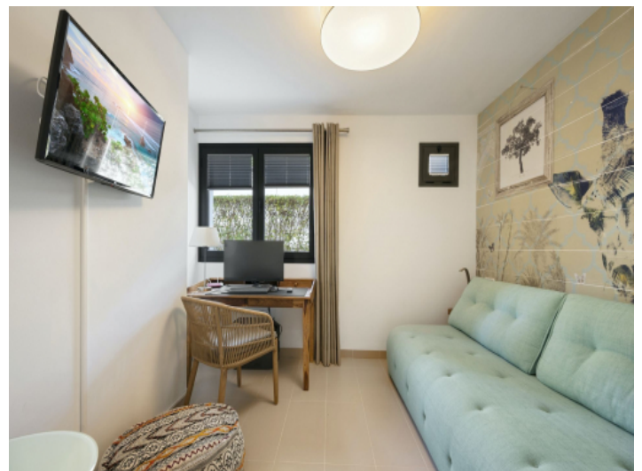
Büro und Gästezimmer