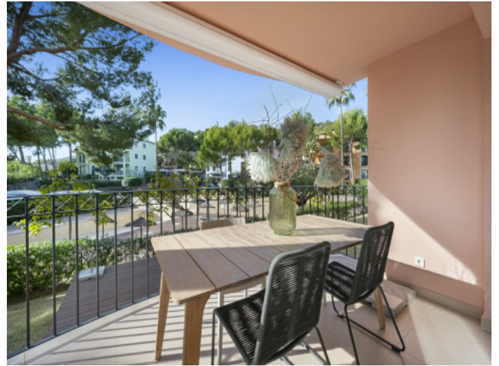
Überdachte Terrasse mit Aussicht auf den Pool