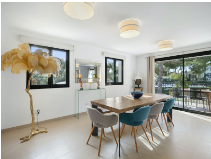
Essecke mit Zugang auf die Terrasse