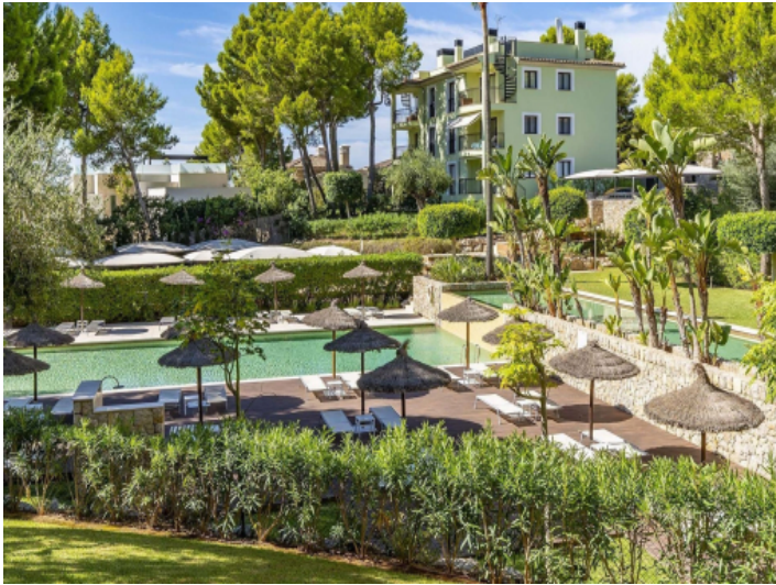
Sehr gepflegter Pool und Gartenbereich