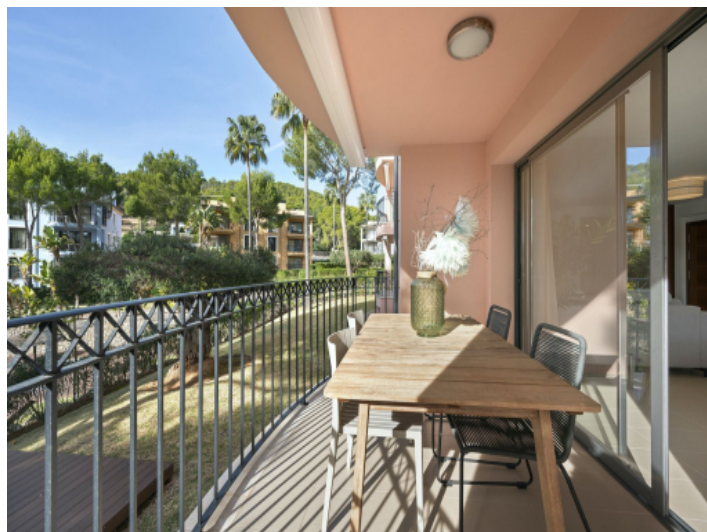
Aussicht vom Balkon