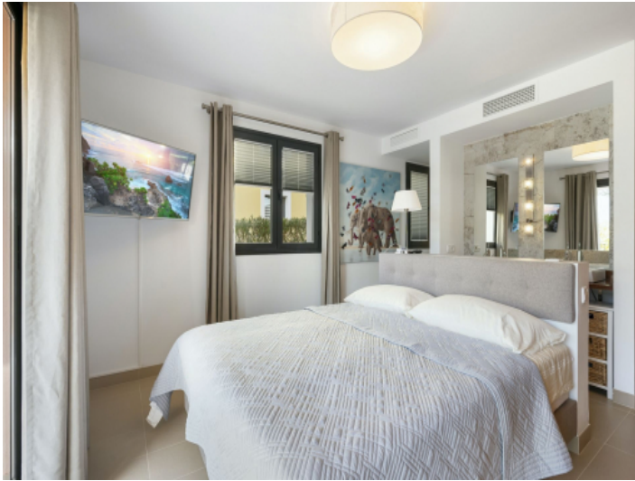
Schlafzimmer mit Bad en Suite