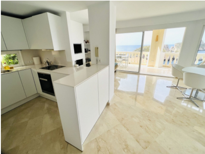
Lichtdurchfluteter Wohnbereich mit offener, moderner Küche