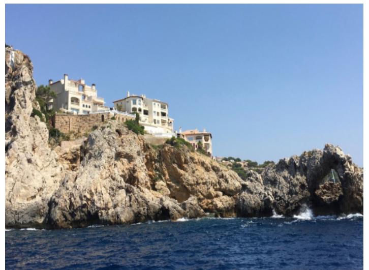
Außenansicht vom Meer