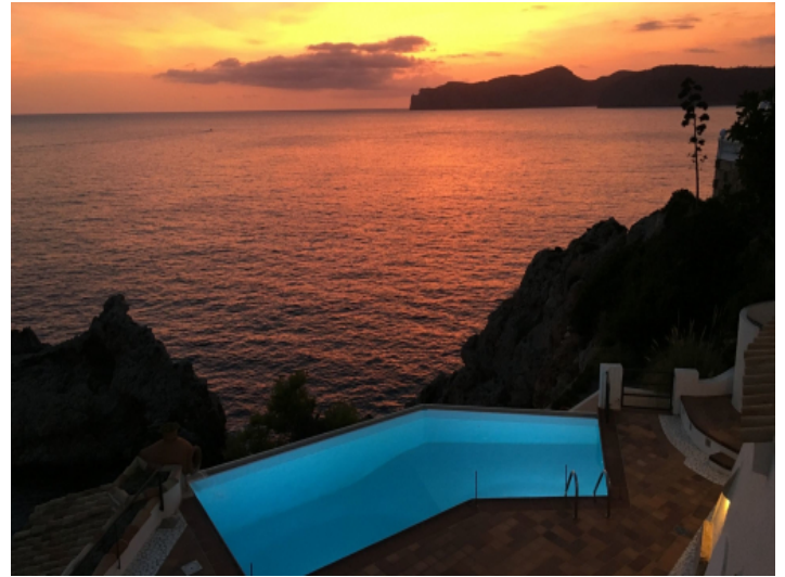
Beleuchteter Gemeinschaftspool mit Meerblick