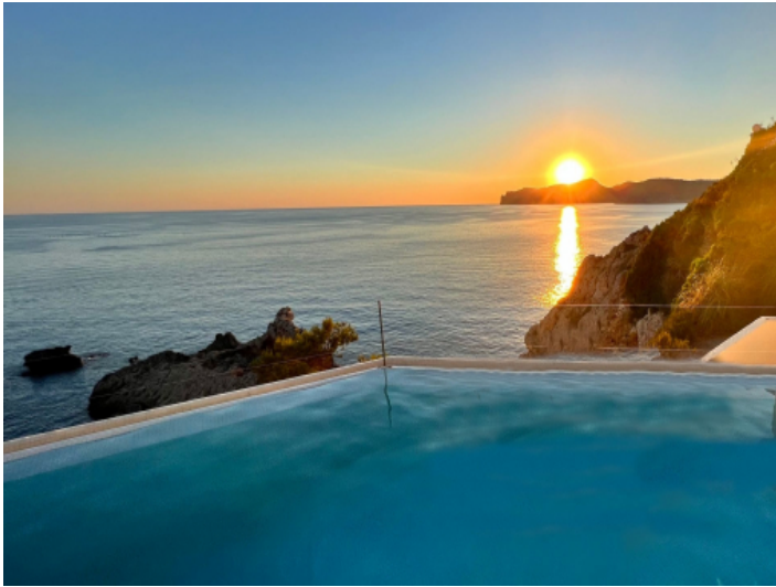
Gemeinschaftspool mit atemberaubendem Ausblick