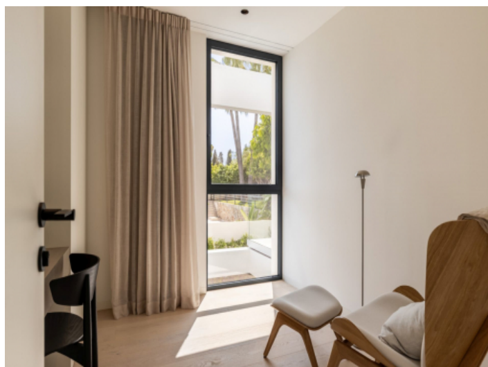
Büro des Penthouses