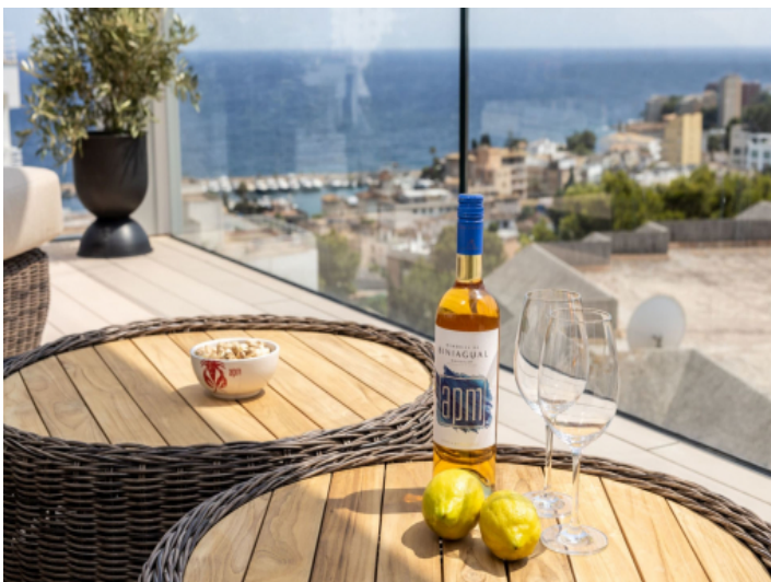
Blick auf das Mittelmeer vom Balkon