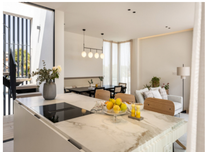
Küche mit Kochinsel