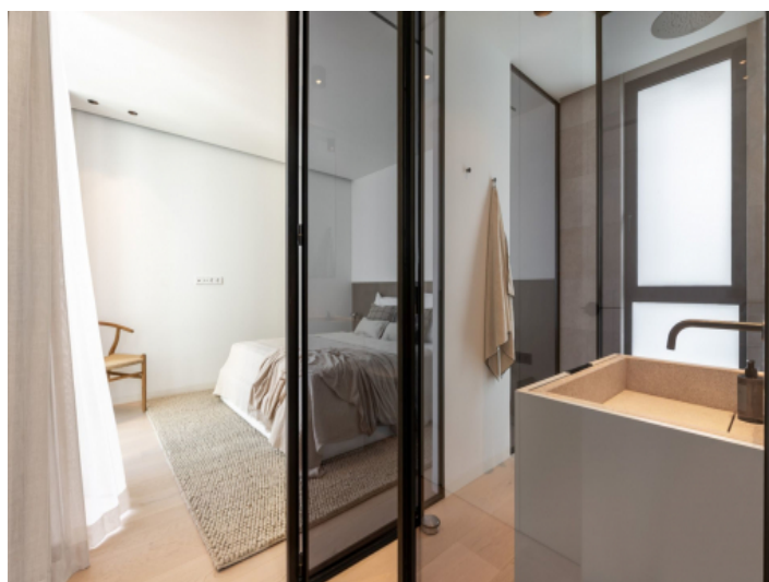
Badezimmer mit Tageslicht