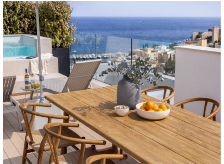
Dachterrasse mit Blick auf das Mittelmeer