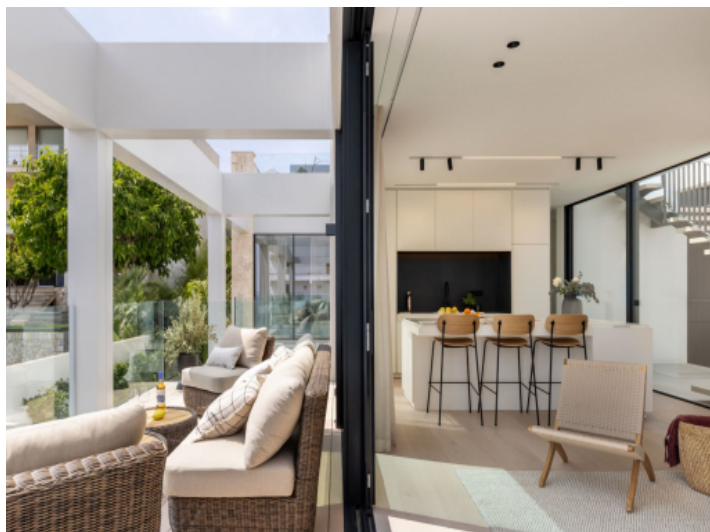
Wohnbereich mit Balkonzugang