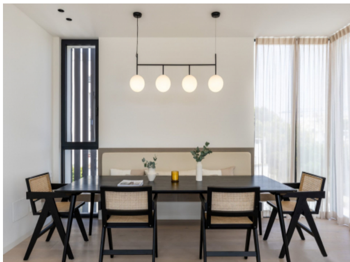
Essbereich des Penthouses