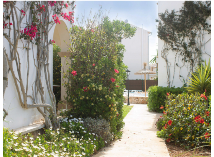
Zugang zur Wohnung