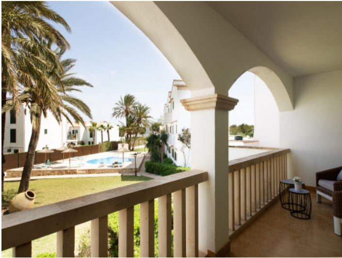
Wohnung, Cala Santanyi