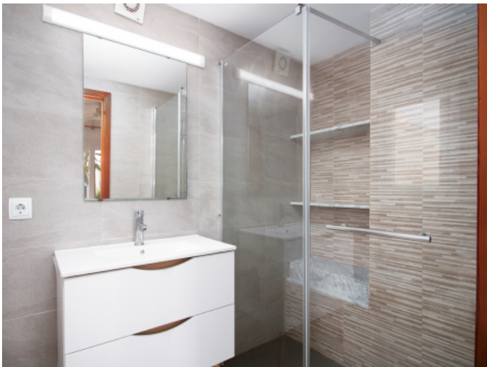
Badezimmer mit ebenerdiger Dusche