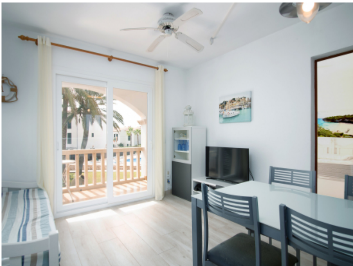
Heller Wohn- und Essbereich