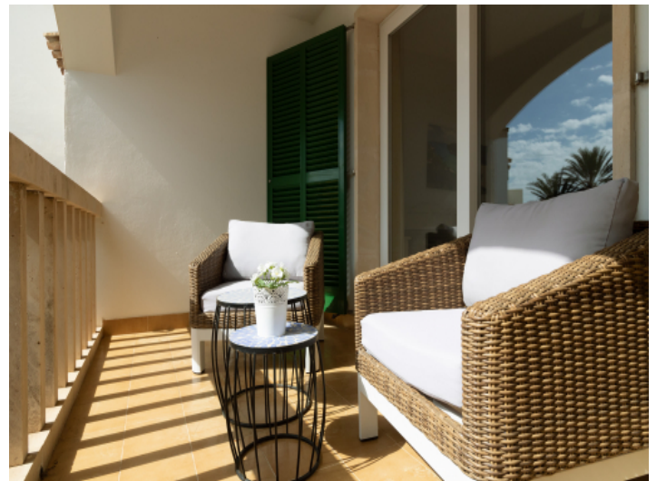
Balkon mit Chill Out Lounge