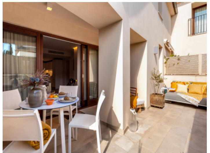
Teilweise überdachte Terrasse