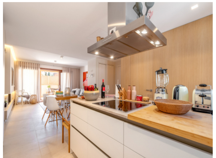
Küche mit Kochinsel