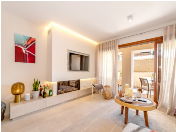
Wohnzimmer mit Kamin