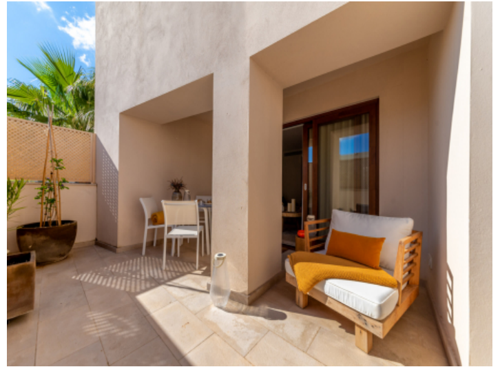
Private Terrasse mit Lounge