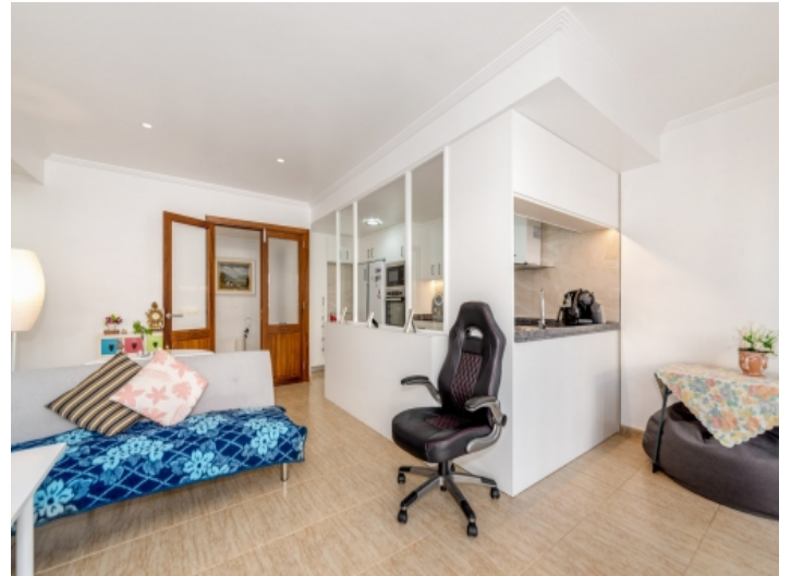
Offener Wohnbereich mit Küche