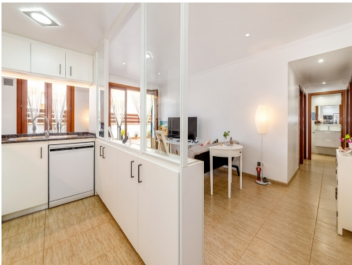
Küche und Essbereich