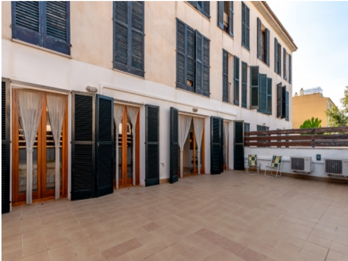
Erdgeschosswohnung mit Terrasse in Arta