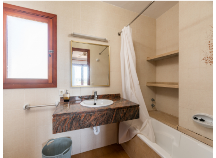
Badezimmer mit Wanne