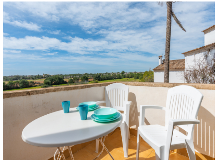
Sitzbereich auf der Terrasse