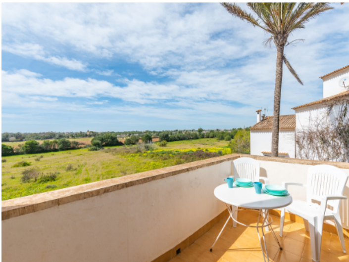
Herrliche Terrasse mit Ausblick