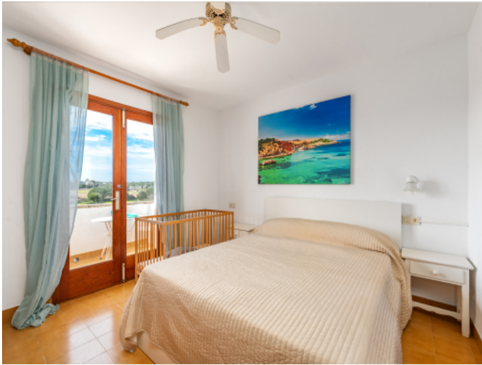
Schlafzimmer mit Terrassenzugang