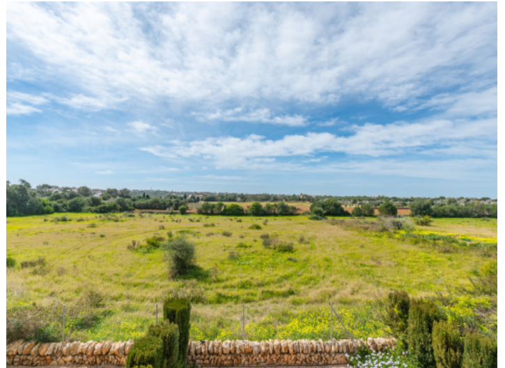
Schöner Landschaftsblick vom Balkon