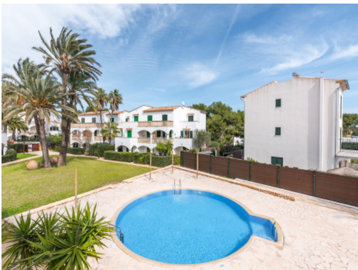
Schöner Pool- und Gartenbereich