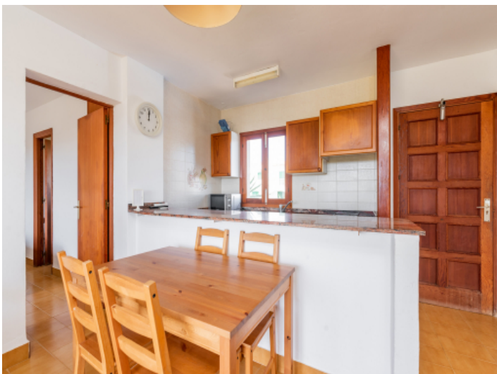
Essbereich mit offener Küche