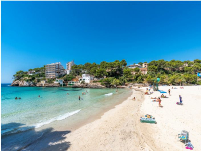
In der Nähe der schönen Bucht