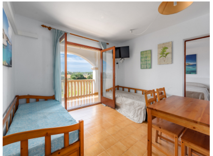
Wohnbereich mit Terrasse