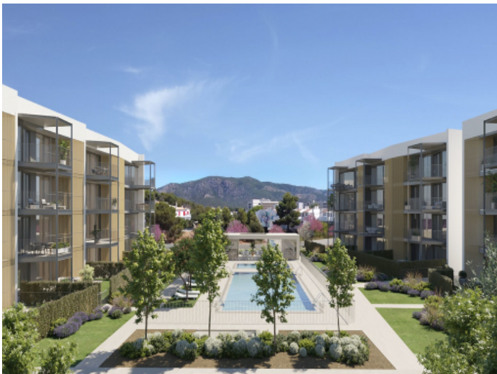
Ansicht auf die Wohnanlage