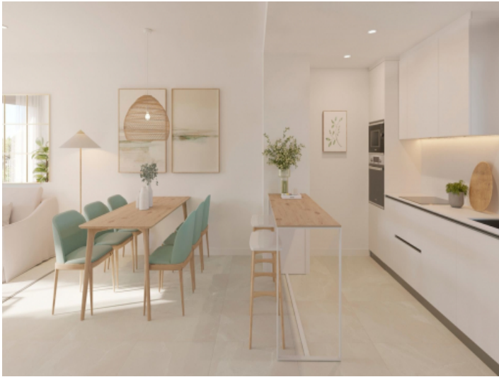
Küchen und Essbereich