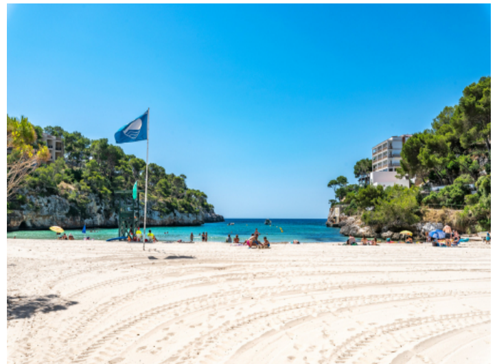
Strand von Cala Santanyi