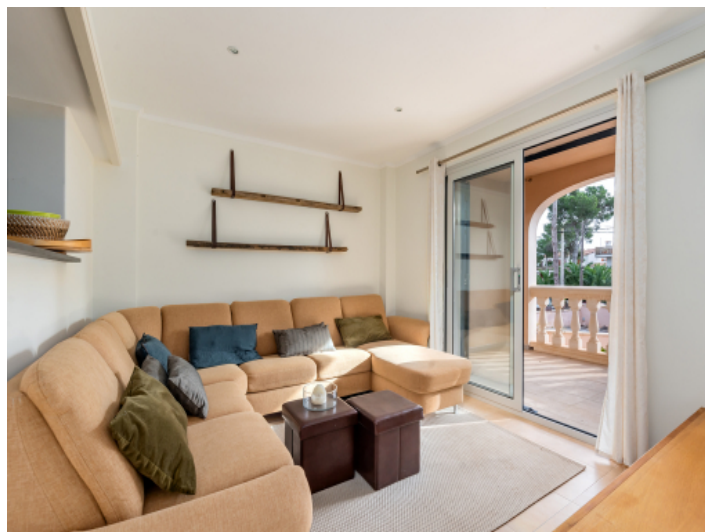
Gemütlicher Wohnbereich mit Zugang auf den Balkon