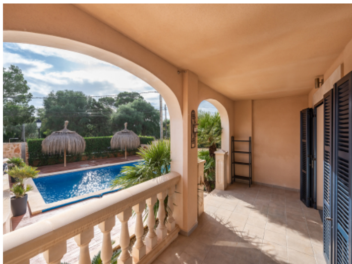
Sonnige Terrasse mit Poolblick