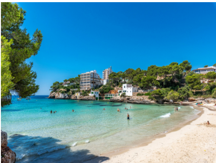
Strand von Cala Santanyi