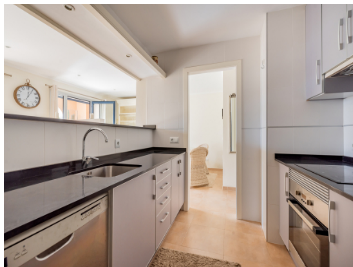
Moderne Küche mit Durchreiche