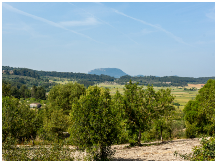
Freier Blick auf die umliegende Natur