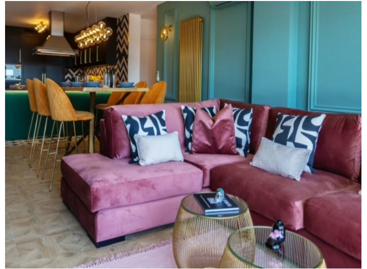
Offener Wohn-und Essbereich