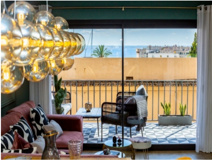
Wohnbereich mit Meerblick