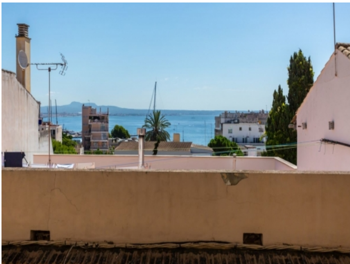
Blick bis zum Meer