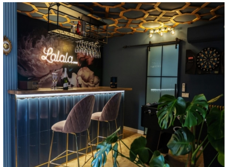
Bar neben der Küche