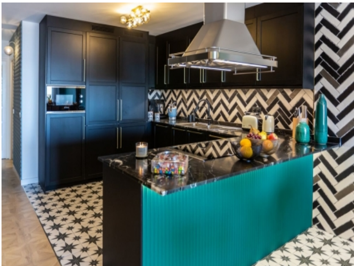
Moderne Küche in schwarz