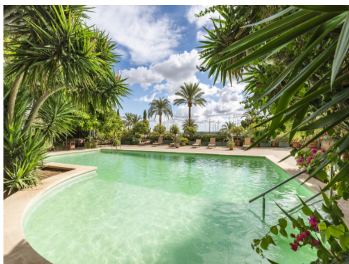
Herrlicher, mediterraner Gemeinschaftspool