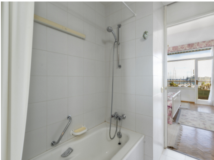
Badezimmer en Suite mit Wanne