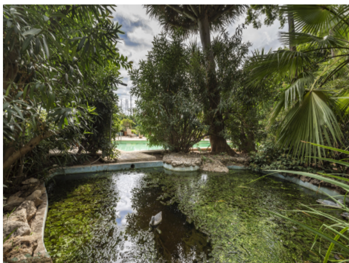
Idyllischer Teich neben dem Pool