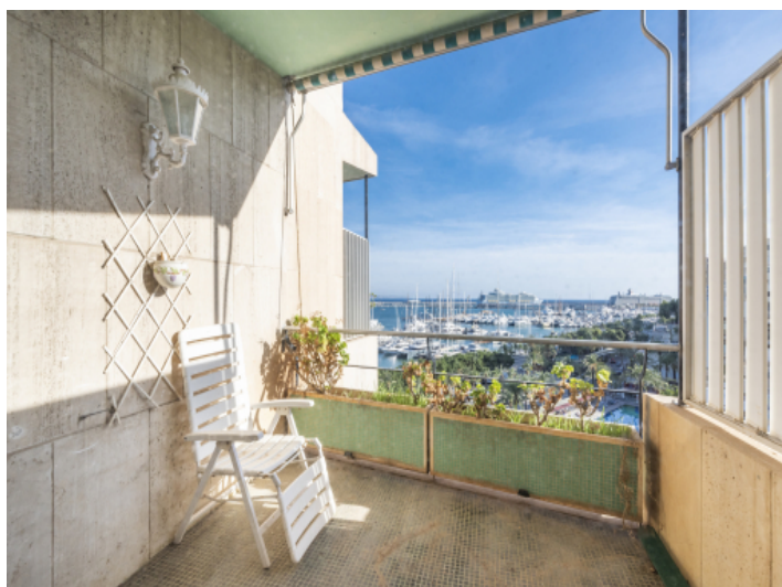
Überdachter Balkon mit Ausblick