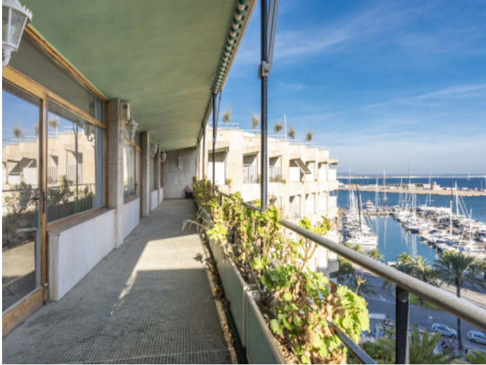
Langer Balkon mit Blick auf den Hafen