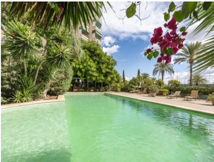
Pool mit Sonnenterrasse