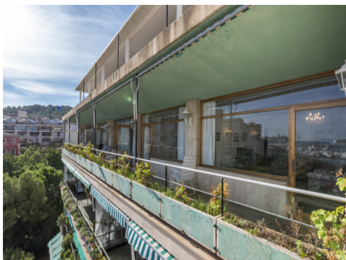
Außenansicht - oder Balkonblick