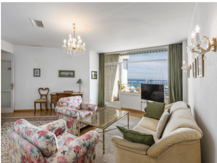
Weiteres Wohnzimmer mit Meerblick