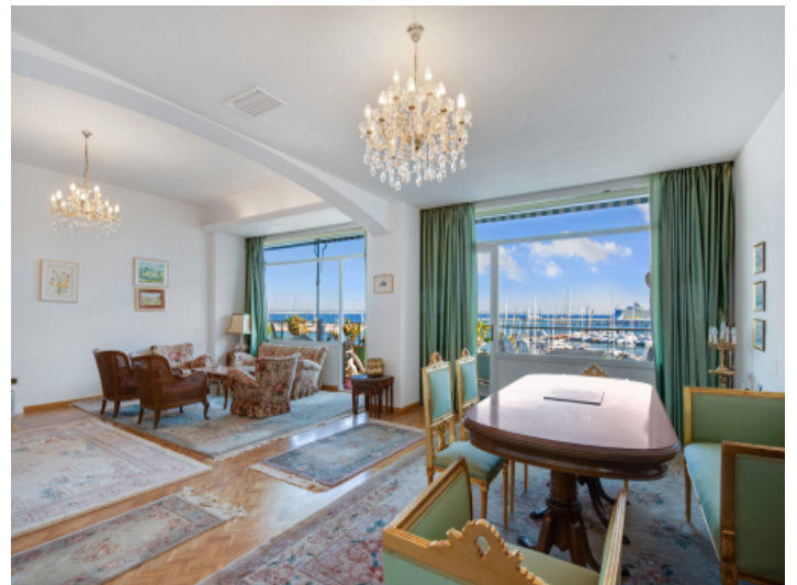
Großer Wohnbereich mit Panoramablick