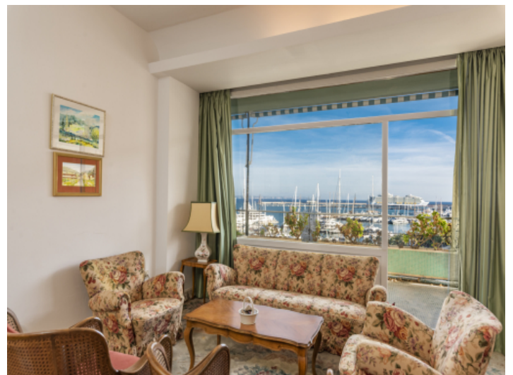
Drittes Wohnzimmer mit fantastischen Ausblick