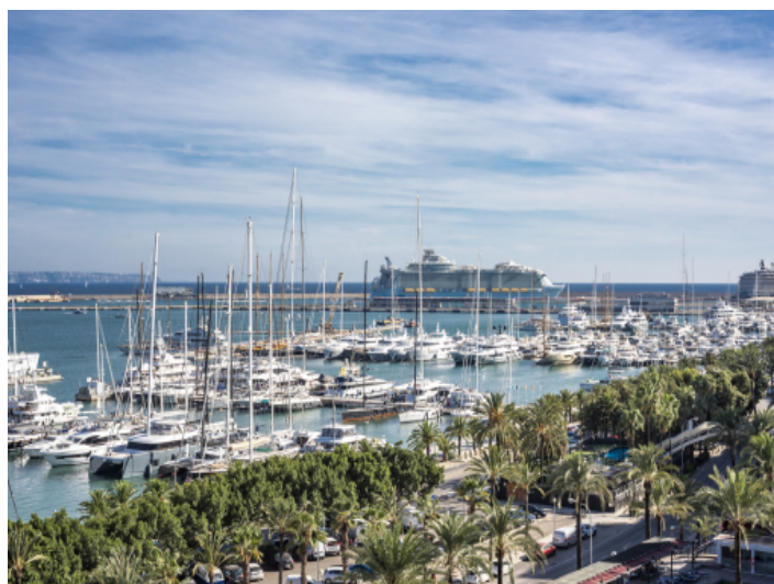
Blick über den Paseo Maritimo