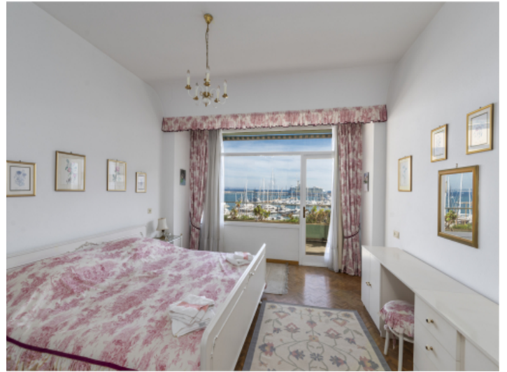
Doppelschlafzimmer mit Meerblick