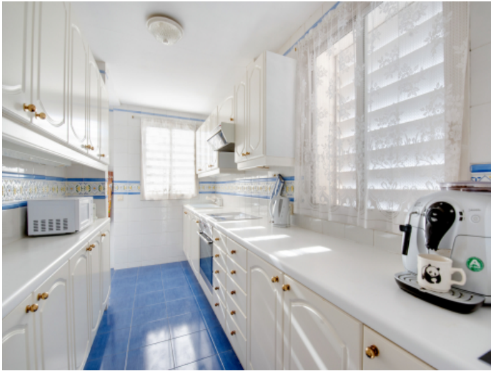
Großzügige Küche in weiss