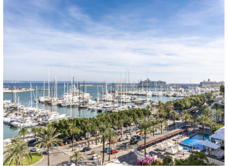
Beeindruckender Blick über den Paseo Maritimo