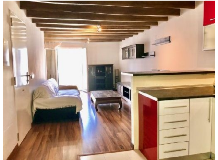
Wohnbereich und Küche