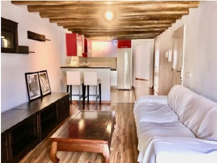
Wohnbereich und Küche