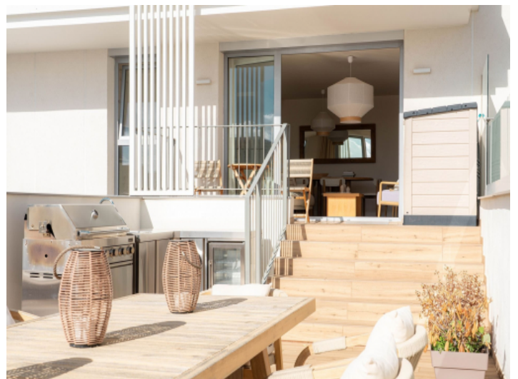
Außenküche mit Grill