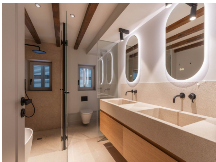
Bad en Suite