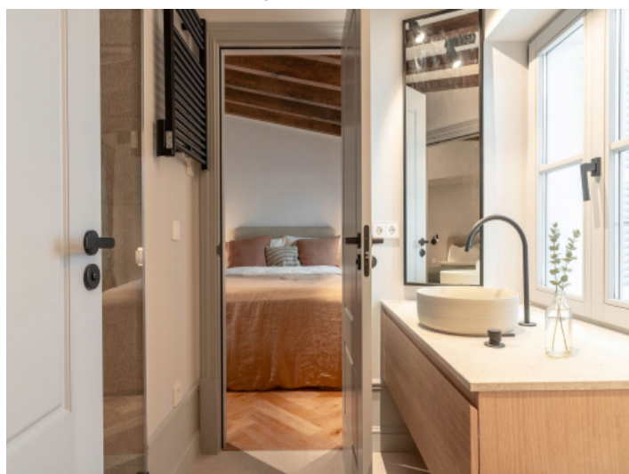
Bad en Suite