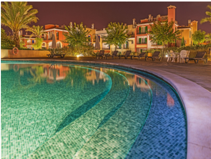
Gemeinschaftspool mit 700 m 2