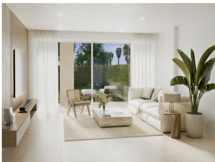
Wohnzimmer im Erdgeschoss mit Garten