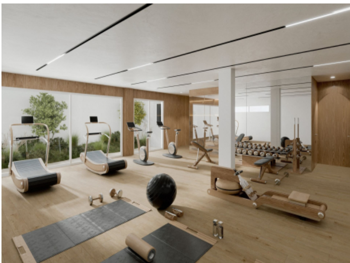
Fitnessraum mit Sauna