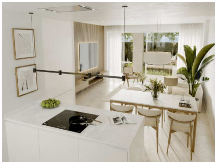
Küche und Esszimmer