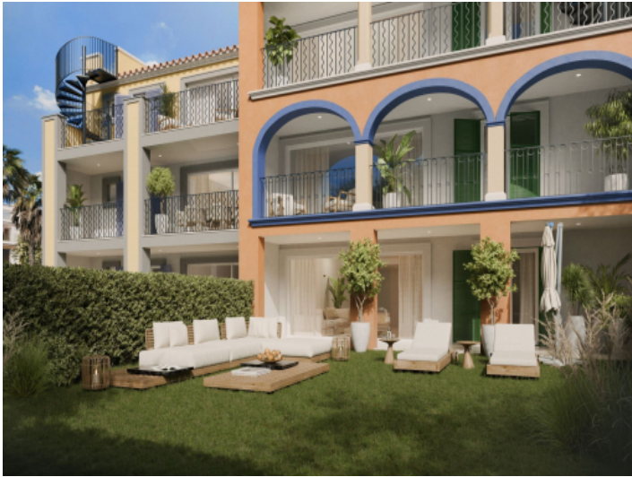
Privater Garten zugehörig zu jeder EG Wohnung