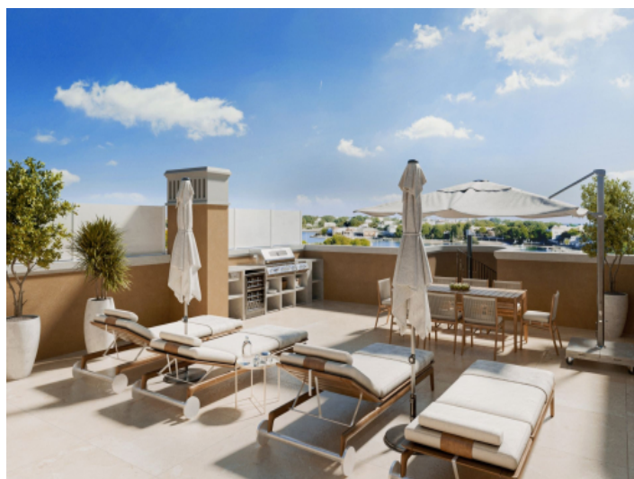
Dachterrasse bei jeder Dachgeschosswohnung vorhanden