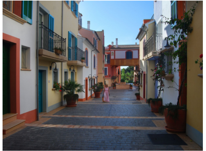
Straßenbild in Gated Community