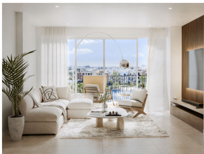
Wohnzimmer der Dachgeschosswohnung