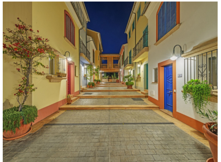
Straßenbild bei Nacht