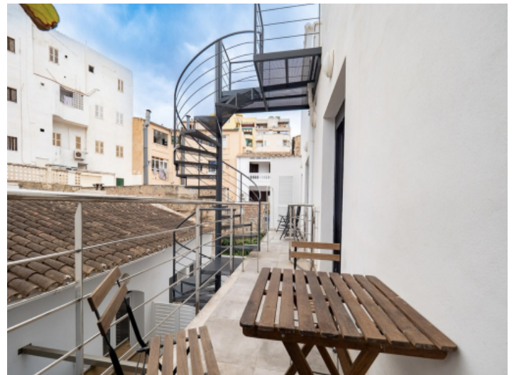
Wendeltreppe zur Dachterrasse