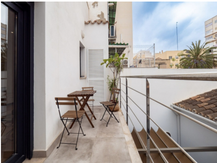
Balkon auf der Wohnebene